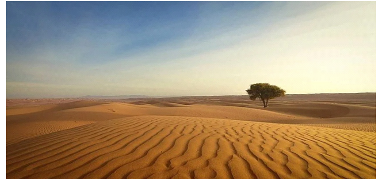
Sa mạc là một trong những dạng địa hình phổ biến ở Trung Quốc.

Quặng đuôi là vật liệu xả thải ra trong quá trình tuyển khoáng. Trong quặng đuôi còn hàm lượng khoáng sản có ích. Bởi quá trình chế biến khoáng sản không bao giờ đạt hiệu suất 100%. Chính vì vậy "chất thải" này vẫn còn là tài nguyên rất quý hiếm.