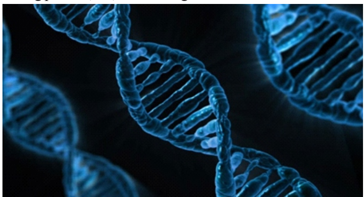
Không phải lúc nào kết quả xét nghiệm DNA cũng là chính xác

Nghi ngờ xét nghiệm của tòa bị sai, Lydia đã xin thực hiện lại xét nghiệm ở một số phòng thí nghiệm độc lập do chính cô lựa chọn. Tuy nhiên kết quả vẫn không có chút thay đổi nào. Kết quả xét nghiệm DNA vẫn cho thấy cô không phải mẹ ruột của những đứa trẻ.