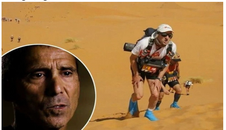
Mauro Prosperi - vận động viên trải qua 10 ngày địa ngục trong Sahara

Năm 1994, trong lúc tham gia cuộc đua marathon kéo dài 6 ngày ngang Sahara, vận động viên (VĐV) Mauro Prosperi xui xẻo bị tách khỏi đội hình. Nước uống dự phòng sớm không còn một giọt, Prosperi đành lấy chai không đựng nước tiểu để dành.