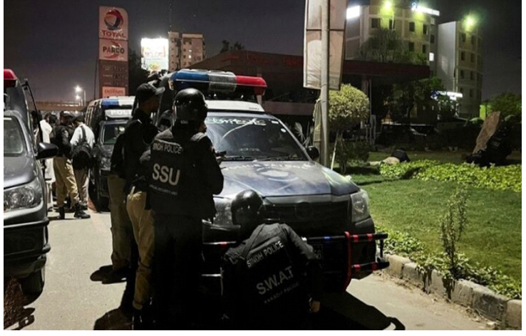
Lực lượng an ninh Pakistan

Kết quả này vượt qua con số của năm 2021 (87 vụ tấn công), ngay cả khi thỏa thuận ngừng bắn kéo dài 4 tháng với Islamabad đã bị các chiến binh đơn phương hủy bỏ vào cuối năm ngoái.