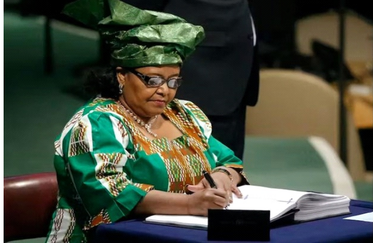
Bộ trưởng Bộ Môi trường Nam Phi Bomo Edna Molewa ký Thỏa thuận Paris vào tháng 4/2016

Ngày 3/4, Chương trình Môi trường Liên hợp quốc (UNEP) cho biết châu Phi ghi nhận tỷ lệ tuân thủ Hiệp định Paris về biến đổi khí hậu ở mức cao nhất.