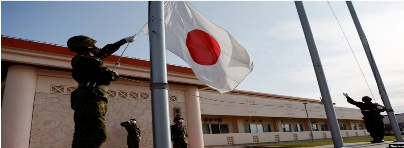
Quốc kỳ Nhật tại căn cứ quân sự Miyako, Okinawa, ngày 20/4/2022.

nhằm tạo ra một môi trường an ninh như kỳ vọng cho Nhật Bản", Bộ Ngoại giao Nhật Bản cho biết trong một tuyên bố.