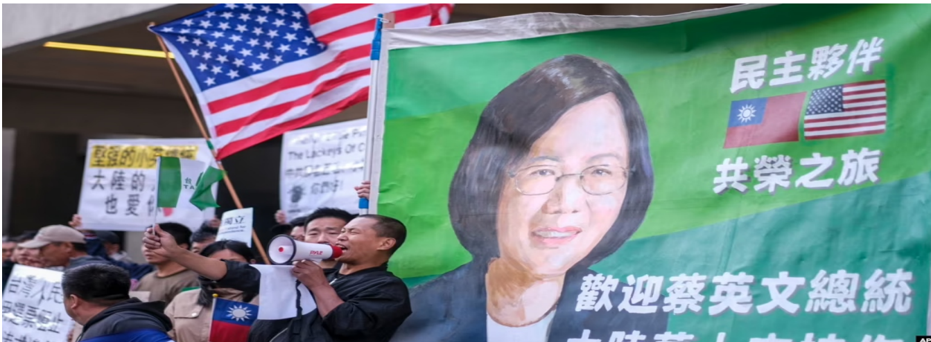
Người ủng hộ Tổng thống Đài Loan Thái Anh Văn bên ngoài khách sạn ở Los Angeles, California, ngày 4/4/2023.

nhất với một tổng thống Đài Loan trên đất Mỹ kể từ khi Washington chuyển sự công nhận ngoại giao từ