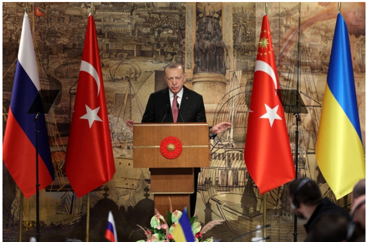
Tổng thống Thổ Nhĩ Kỳ Recep Tayyip Erdoğan

Một số nguồn tin riêng nói với Politico rằng, có những ý kiến trong nội bộ NATO bày tỏ tức giận với cách tiếp cận theo chủ nghĩa can thiệp của Thổ Nhĩ Kỳ. Trong một động thái mang tính biểu tượng, Nhà Trắng đã không mời các quan chức Thổ Nhĩ Kỳ tham dự Hội nghị thượng đỉnh vì dân chủ. Và một số nhà quan sát đang đặt câu hỏi làm thế nào mà Thổ Nhĩ Kỳ, một thành viên của NATO từ năm 1952, thậm chí có thể phù hợp với liên minh phòng thủ của phương Tây.