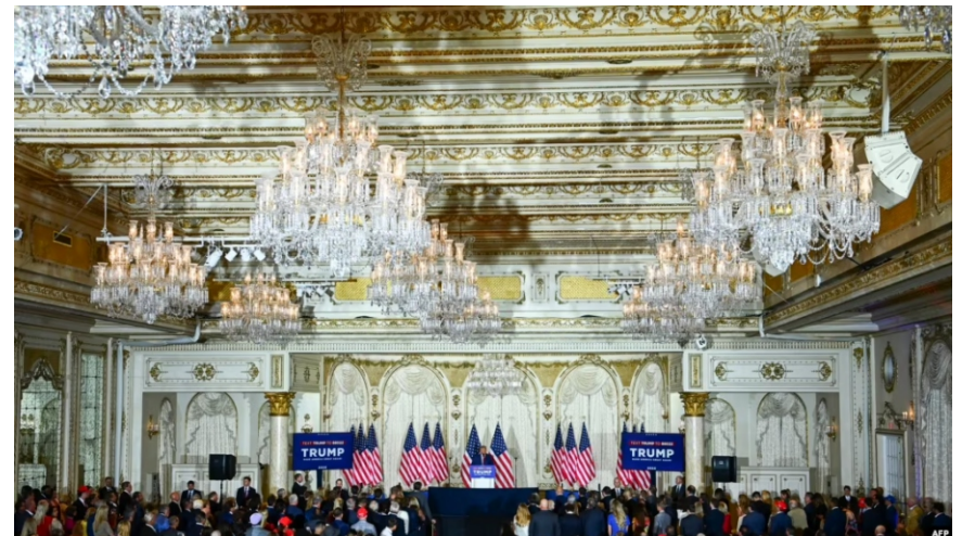
Ông Donald Trump phát biểu tại khu nghỉ dưỡng Mar-a-Lago của ông ở Palm Beach, bang Florida, tối ngày 4/4/2023.

thể xảy ra ở Mỹ", ông Trump nói với những người ủng hộ tập trung tại khu nghỉ dưỡng Mar-a-