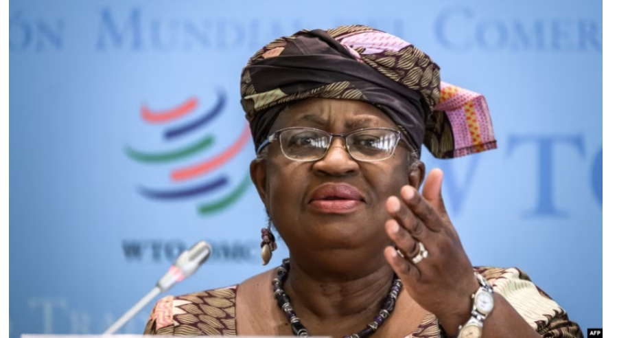
Tổng Giám đốc WTO Ngozi Okonjo-Iweala.

sở tại Geneva cho biết hôm 5/4 rằng kim ngạch thương mại hàng hóa sẽ tăng "dưới mức trung bình", chỉ là 1,7% vào năm 2023. Con số này cao hơn so với mức