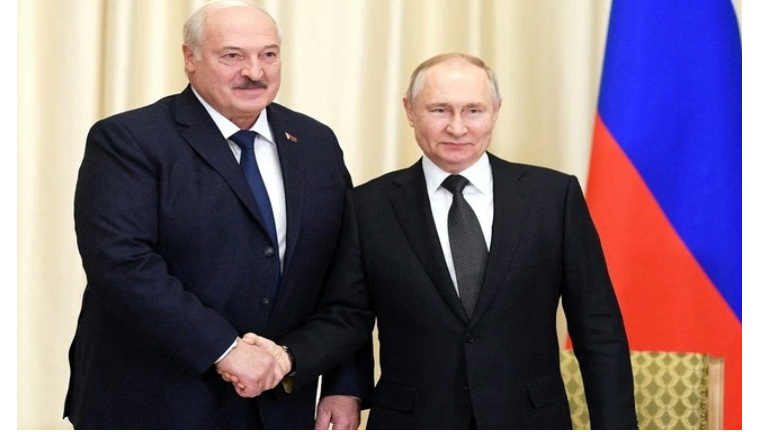
Tổng thống Nga Vladimir Putin và Tổng thống Belarus Alexander Lukashenko

Mỹ và các đồng minh khác của Kiev cho biết họ lo ngại về khả năng Nga sẽ gửi vũ khí hạt nhân chiến thuật đến Belarus.