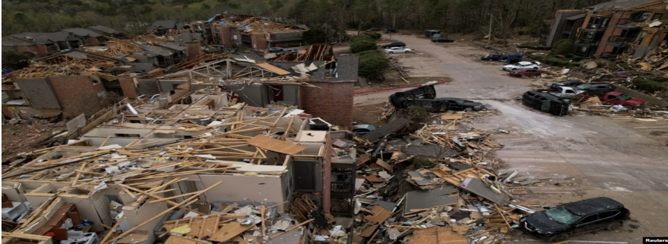
Bão gây lốc xoáy ở miền Nam và Trung Tây Hoa Kỳ, ngày 2/4/2023.

kiến sẽ ập vào một số khu vực đã bị ảnh hưởng bởi thời tiết khắc nghiệt và có thể là hàng chục cơn lốc xoáy mà chỉ vài ngày trước đã giết chết ít nhất 32 người, và điều đó đồng nghĩa với việc những