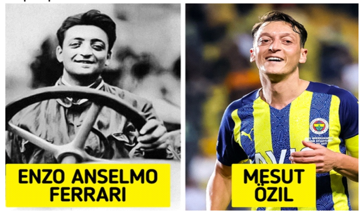
ENZO ANSELMO FERRARI and MESUT OZIL