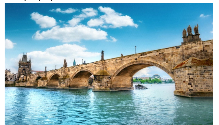
Cầu Charles, cây cầu lịch sử ở Prague

Xong phần móng là có thể bắt đầu thi công từ các trụ cầu. Riêng đối với phần vòm, phương án xây dựng thường là sử dụng những hệ thống giàn giáo bằng gỗ rồi đặt lên trên đó các khối sa thạch hoặc granit (được cắt gọt chính xác) vào đúng vị trí, tiếp đến là tháo dỡ giàn giáo để vòm tự chịu lực.