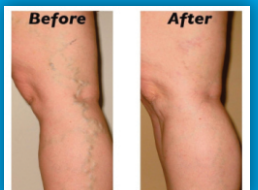
*Hình ảnh kết quả sau khi điều trị