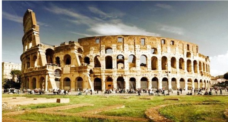
Đấu trường La Mã ở Rome

Võ sĩ giác đấu là những chiến binh được huấn luyện để mua vui cho tầng lớp quý tộc thời La Mã cổ đại. Họ được trang bị đầy đủ vũ khí và tham gia vào các trận chiến sinh tử với những đấu sĩ khác, hoặc thậm chí cả thú dữ.