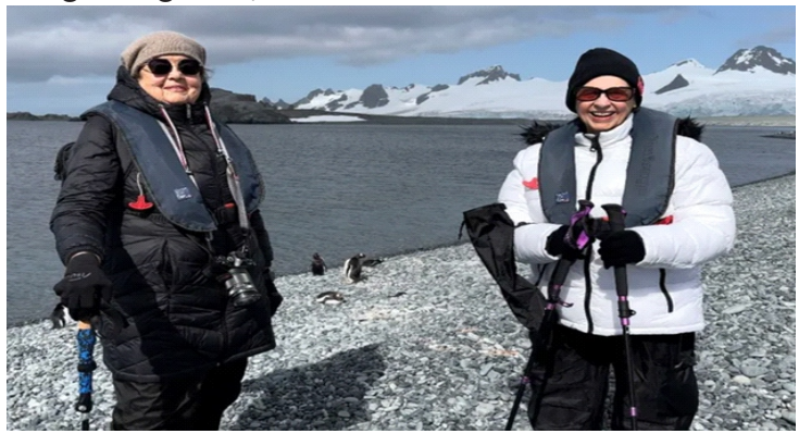
Hai bà nổi tiếng khắp TikTok

Trong gần ba tháng du ngoạn khắp nơi trên thế giới, hai bà bạn già đã có những trải nghiệm cực thú vị: cưỡi trên lưng những chú lạc đà ở Ai Cập, tung đồng xu trước đài phun nước Trevi ở Rome, chụp ảnh selfie với khi duôi dài ở Bali và cưỡi trên những chú chó kéo xe trượt tuyết tại vùng Bắc Cực. Dù lịch trình dày đặc nhưng những chuyến đi đó không làm giảm đi sự nhiệt huyết bùng cháy trong con người họ.