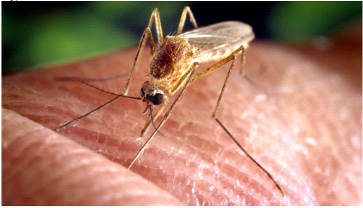
Việc thay đổi tỷ lệ muỗi đực có khả năng sinh sản và vô sinh sẽ giúp kiểm soát quần thể muỗi hiệu quả

“Trong quá trình giao phối, phần bụng của muỗi nổi với nhau và con đực sẽ chuyển tinh trùng vào đường sinh sản con cái. Một loại protein chuyên biệt được tiết ra trong quá trình xuất tinh sẽ kích hoạt 'flagella' hoặc đuôi của tinh trùng. Điều này thúc đẩy sự di chuyển của tinh trùng và đóng vai trò rất quan trọng cho quá trình thụ tinh cùng trứng”, nhà sinh học tế bào Cathy Thaler - tác giả của nghiên cứu - nói.