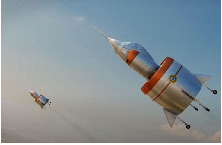
Coléoptère được đưa vào thử nghiệm bay thực tế

Kể từ buổi bình minh của loài người, chúng ta đã nhìn lên bầu trời và khao khát được bay lượn như những con chim. Nhưng ngay cả người có ít sự nhạy bén và hiểu biết về hàng không nhất cũng biết rằng để bay được, bạn cần có đôi cánh để tạo lực nâng giúp máy bay hoặc bất cứ thứ gì tương tự để cất cánh.