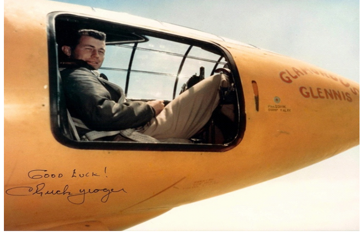
Chuck Yeager đứng bên cạnh chiếc máy bay Bell X-1

T háng 10/1947, phi công người Mỹ Charles Edward Chuck Yeager đã tạo nên cột mốc đáng nhớ của lịch sử ngành hàng không khi trở thành người đầu tiên lái một chiếc máy bay thử nghiệm bay vượt qua tốc độ âm thanh, đặt nền móng cho sự ra đời của các chiến đấu cơ siêu thanh sau này.