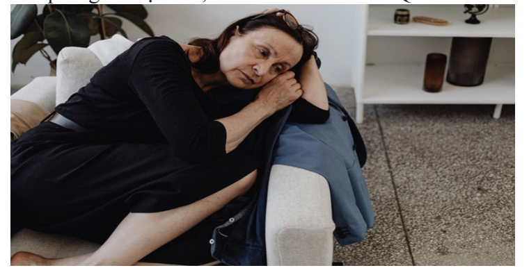
Sức khỏe của người Mỹ đang suy giảm nhanh chóng

Theo New York Post, Mỹ từng tự hào là một trong những quốc gia có tuổi thọ cao, xếp thứ 13 trên tổng thể vào năm 1950. Tuy nhiên, theo một nghiên cứu được công bố trên US News, người Mỹ có tuổi thọ trung bình thấp nhất dù chi nhiều tiền cho chăm sóc sức khỏe. Mỹ đã chi gần 18% tổng sản phẩm quốc nội cho chăm sóc sức khỏe vào năm 2021, theo The Commonwealth Fund. Nước chi tiêu nhiều tiếp theo là Đức với chỉ dưới 13%, trong khi mức trung bình của Tổ chức Hợp tác và Phát triển Kinh tế (OECD) là 9,6%. Tổng chi tiêu chăm sóc sức khỏe của Mỹ gần gấp đôi so với Đức và ít gấp ba lần số tiền chi tiêu của các quốc gia Nhật Bản, New Zealand và Hàn Quốc.