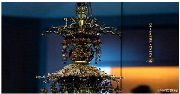
Cận cảnh của các phần trên thân bảo tháp

Ba cậu nhóc đam mê khám phá đã tìm mọi cách trèo lên tầng trên dù cầu thang đã hỏng. Khi leo đến tầng thứ ba của tòa tháp, chúng phát hiện ra một cái lỗ lớn ở đó. Cả nhóm vui mừng tưởng đó là tổ chim nên đã ra sức đào một cái lỗ lớn. Không rõ vì sao, chúng càng đào cái lỗ càng lớn cho tới khi đụng phải một phiến đá. Sau khi đẩy được phiến đá, chúng lại thấy xuất hiện một cái hồ sâu nên liền chui xuống cái hồ để bắt đầu “hành trình phiêu lưu”. Và cuộc phiêu lưu này đã tạo ra vô số bất ngờ.