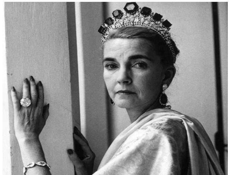
Xinh đẹp và khí chất nên tiểu thư giàu có hút cánh săn tin chẳng kém ngôi sao nào

Barbara Hutton là một trong những người thừa kế giàu có nhất thế giới thế kỷ 20, nhưng cuộc đời bà chỉ là một chuỗi những bi kịch với 7 đời chồng và cái kết cô độc, nghèo đói lúc cuối đời.