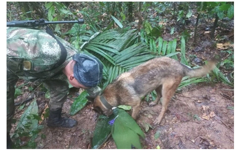
Một lính cứu hộ và một chú chó nghiệp vụ tham gia chiến dịch đã tìm thấy 4 trẻ em mất tích trong rừng rậm ở Colombia hôm 17-5

Kể thêm về quá trình tìm kiếm, lực lượng cứu hộ cho biết đã phát hiện một lần trú ẩn tạm thời làm bằng cành cây: “Chi tiết này giúp chúng tôi khẳng định giả thiết có ít nhất một nạn nhân sống sót”.