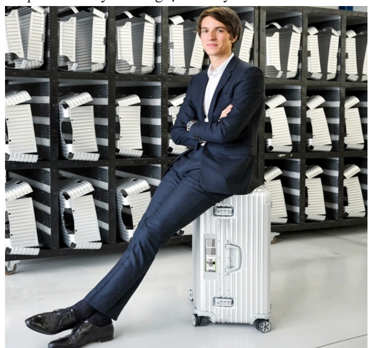
Alexandre trở thành giám đốc của Rimowa khi mới 25 tuổi

Năm 2017, người thừa kế sinh năm 1992 được bổ nhiệm làm lãnh đạo hãng sản xuất vali xa xỉ Rimowa sau khi LVMH mua lại 80% cổ phần của công ty. Năm 2019, anh tiếp quản chiếc ghế của cha mình trong hội đồng quản trị tại Carrefour, chuỗi siêu thị của Pháp. Cuối cùng, vào năm ngoái, Alexandre đã trở thành phó chủ tịch điều hành sản phẩm và truyền thông tại Tiffany & Co.