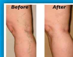
*Hình ảnh kết quả sau khi điều trị