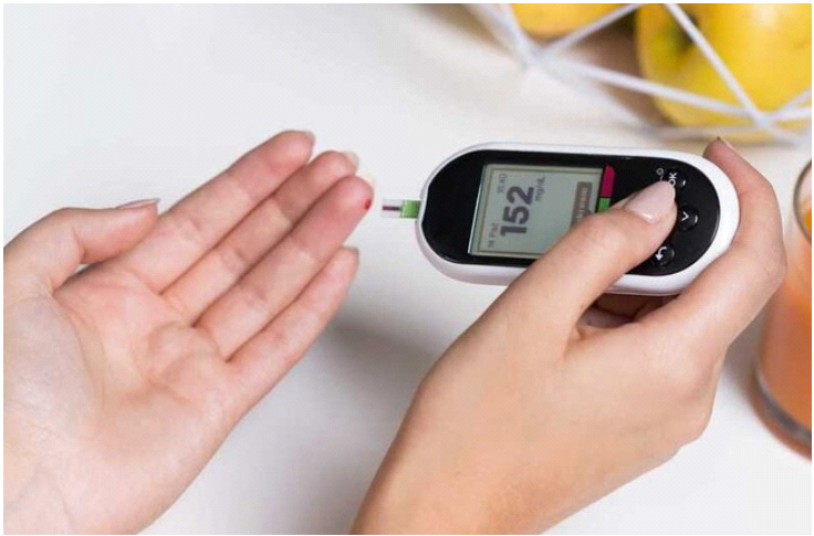
Bệnh tiểu đường đang ngày càng trẻ hóa do lối sống không lành mạnh ở người trẻ

Nấm âm đạo không phải là bệnh truyền nhiễm qua đường tình dục và không nguy hiểm đến tính mạng, nhưng nó lại gây khó chịu và mất tự tin cho phụ nữ. Trong một số trường hợp, bệnh có thể dẫn đến các biến chứng nghiêm trọng như viêm nhiễm cổ tử cung, buồng trứng và thậm chí là vô sinh. Khi đường huyết trong máu tăng cao, cơ thể sẽ bài tiết đường glucose dư thừa thông qua nước tiểu. Khi đi qua âm đạo, glucose sẽ phá vỡ cân bằng hệ vi khuẩn ở âm đạo, tạo điều kiện cho nấm phát triển và sinh sôi.