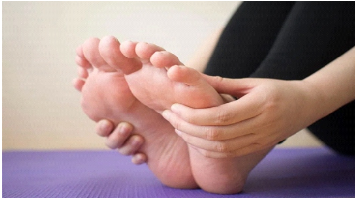
Tê chân là dấu hiệu nhiều bệnh liên quan hệ thần kinh, mạch máu não

Phụ nữ bước vào thời kỳ mãn kinh cần đặc biệt chú ý đến các tín hiệu do cơ thể phát đi, để kịp thời phát hiện manh mối của các bệnh lý (nếu có). Những bất thường ở chân dưới đây cho thấy phụ nữ có thể bị rút ngắn tuổi thọ.