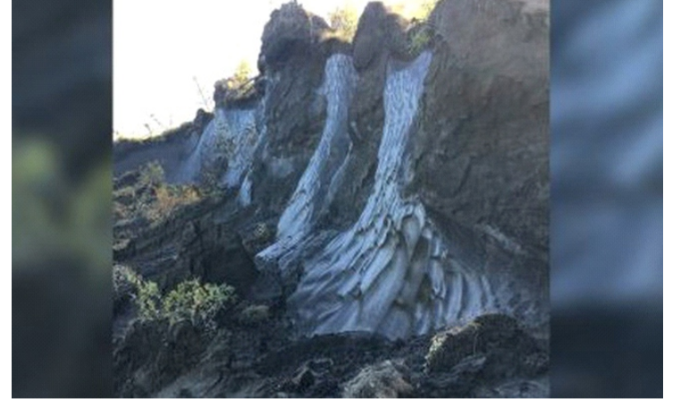
Sự tan băng vĩnh cửu đang diễn ra ngày càng nhanh

Claverie và các cộng sự đã phân lập được tổng cộng 7 họ virus cổ đại. Điều đặc biệt hơn là khi được kích hoạt, những virus này vẫn có khả năng lây nhiễm. Tuy những chủng này chỉ có thể tấn công các amip đơn bào, không thể tấn công con người và động vật, đây vẫn là dấu hiệu của một nguy cơ tiềm ẩn lớn hơn: "Nếu virus amip vẫn còn có thể sống lại thì không có lý do gì khiến các virus khác đã chết".