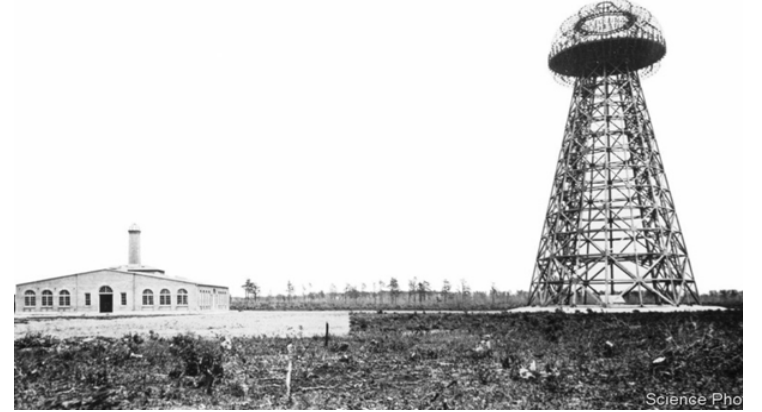
Tòa tháp cao 57 mét đã từng ở Long Island, New York.

Họ muốn tìm cách truyền năng lượng từ một nhà máy điện mặt trời trên North Island, New Zealand, tới các khách hàng cách đó vài km.