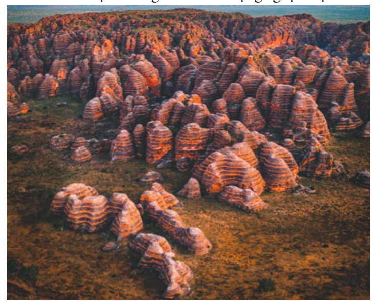
Khu vực phổ biến nhất của công viên Purnululu là dãy Bungle Bungle

Ở vùng Kimberley của Tây Úc là Công viên Quốc gia Purnululu. Đây là nơi có dãy Bungle Bungle nổi bật với các đá sa thạch mang nhiều hình dạng ngoạn mục.