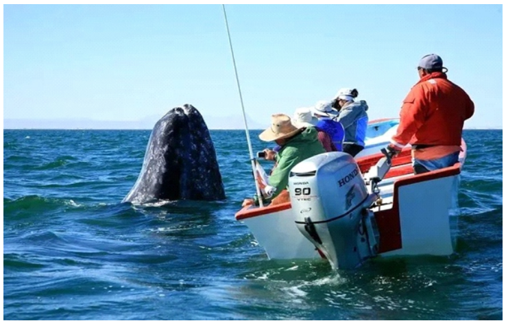
Ở Baja California, tàu ngắm cá voi có thể tiếp cận cá voi xám, và một số cá voi mẹ và con thậm chí còn tỏ mò chủ động tiếp cận tàu và quan sát con người

Để quản lý hoạt động quan sát cá voi một cách có trật tự và tránh xung đột với cuộc sống bình thường của cá voi, cơ quan quản lý của ngành công nghiệp quan sát cá voi ra đời.