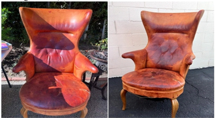
Chiếc ghế da đã cũ và sờn rách được rao bán với giá 50 đô la

“Tôi đã xem từng tập của chương trình Antiques Roadshow (một chương trình kiểm nghiệm đồ cổ của đài BBC). Tôi thờ và sống cùng đồ cổ. Dù không phải là chuyên gia, nhưng tôi có mắt nhìn khá tốt, và ngay khi nhìn thấy chiếc ghế, tôi đã tự nhủ với mình rằng, nó đúng là 1 chiếc ghế thú vị”, Justin chia sẻ thêm.