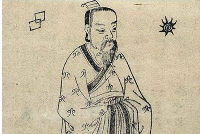
Tranh vẽ Biển Thước