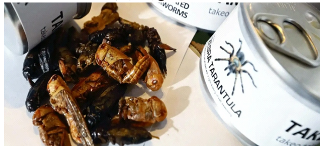
Món ăn từ tằm và nhện cũng được nhiều người lựa chọn

Phát ngôn viên công ty, Fumiya Aokubu cho biết: “Dế từ lâu đã là món ăn quen thuộc đối với người Nhật. Chúng tôi coi đó là nguồn tài nguyên tiềm năng, quan trọng và hữu ích. Nuôi dế rất thân thiện với môi trường, bởi tốn ít đất, ít nước và ít nguyên liệu. Đồng thời, nuôi dế cũng năng suất hơn nhiều so với lợn, bò, gà”.