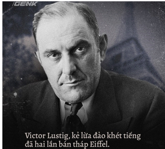
Victor Lustig, kẻ lừa đảo khét tiếng đã hai lần bán tháp Eiffel.

Bá tước Lustig đã cả gan rao bán tháp Eiffel cho các tay buôn sắt vụn, thậm chí còn mở bán tới... hai lần, nhiều lần bán thành công một chiếc hộp được quảng cáo là có thể in ra những bản sao hoàn hảo của tờ 100 USD, thậm chí hắn còn dám lừa một trong những tay trùm mafia giàu có và nguy hiểm nhất lịch sử nước Mỹ - Al Capone. Tinh ranh như Al Capone cũng chẳng biết là mình đã bị lừa.