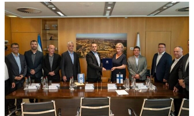
Phần Lan ký hợp đồng mua hệ thống phòng thủ tên lửa David's Sling của Israel

Mặc dù xung đột leo thang giữa Israel và Phong trào Hồi giáo Hamas từ đầu tháng 10, Phần Lan tin tưởng rằng tình hình sẽ không ảnh hưởng đến thỏa thuận.