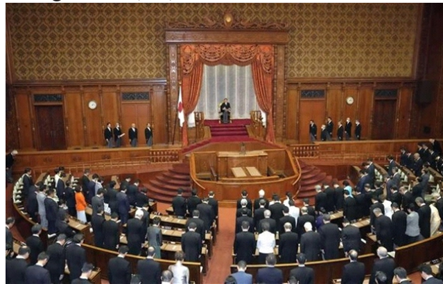
Toàn cảnh phiên họp Quốc hội Nhật Bản tại thủ đô Tokyo, ngày 20/10/2023

Với việc 2 thành viên trong Nội các của Thủ tướng Kishida từ chức sau cuộc cải tổ hồi tháng 9 năm nay, các nghị sĩ của đảng Dân chủ Tự do (LDP) cầm quyền ở Nhật Bản đã phải kêu gọi hoãn giải tán Hạ viện.