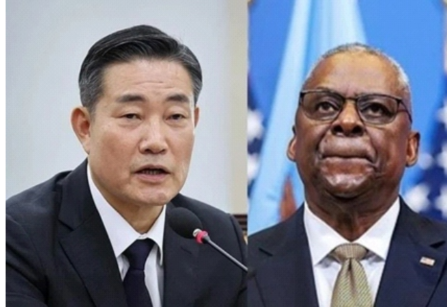
Bộ trưởng Quốc phòng Hàn Quốc Shin Won-sik và người đồng cấp Mỹ Lloyd Austin

Theo hãng tin Yonhap, Bộ Quốc phòng Hàn Quốc ngày 9/11 thông báo các bộ trưởng quốc phòng của nước này và Mỹ sẽ tiến hành Hội nghị Tham vấn An ninh thường niên giữa hai bên vào tuần tới.