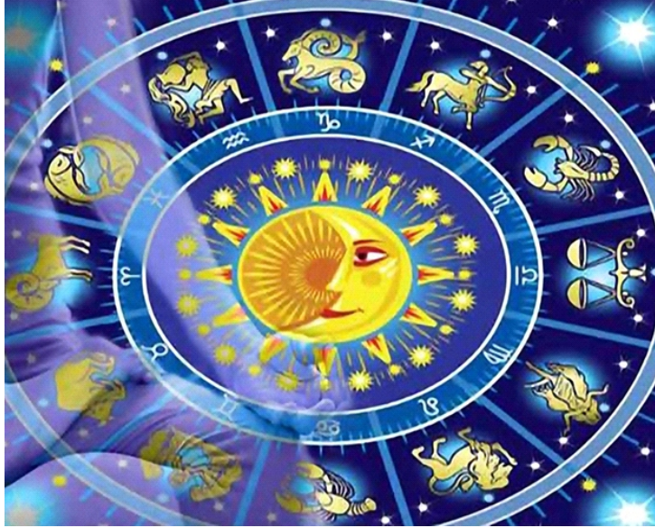
Biểu tượng 12 cung hoàng đạo trong chiêm tinh học hiện đại

Chiêm tinh học phương Tây có nguồn gốc từ người Babylon cổ đại. Những kiến thức chiêm tinh đầu tiên được phát triển bởi các linh mục, nhằm mục đích giải mã ý muốn của các vị thần.