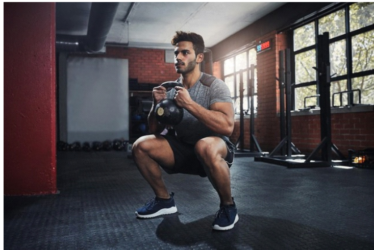
Cả hai vị chuyên gia đều đồng tình rằng squat là một trong những bài tập tốt nhất để tăng sức mạnh và nhịp tim. (Ảnh minh họa)

Giáo sư Murphy cho biết: "Khi thực hiện squat, bạn sẽ làm cho hệ thống tim mạch của mình hoạt động vì các cơ lớn cần nhiều oxy. Vì vậy, nếu bạn sử dụng hai trong số các cơ lớn nhất trong cơ thể - cơ đùi trước và cơ mông - bạn sẽ giúp ích cho hệ thống tim mạch cũng như hệ thống cơ bắp. Tôi rất khuyến khích tập động tác này".