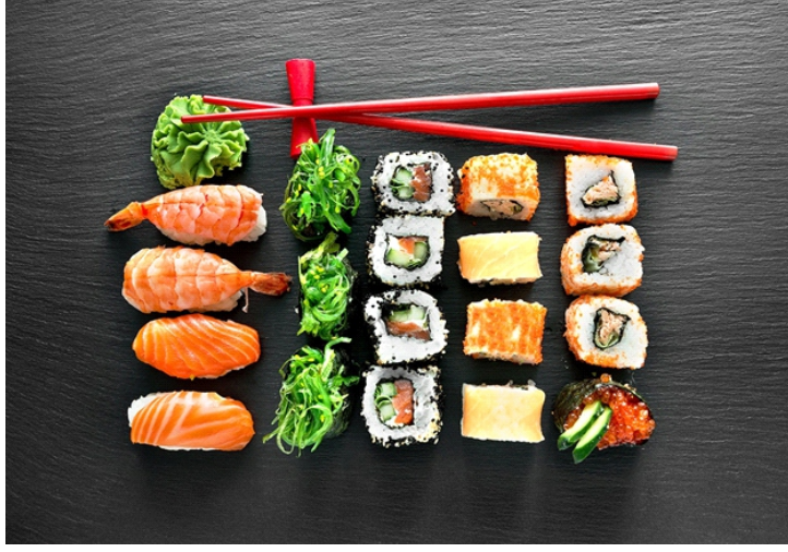
Đáng ngạc nhiên, sushi lại không phải là phát minh của người Nhật

Món ăn “quốc hồn quốc túy” hay môn nghệ thuật chinh phục thế giới này của người Nhật lại có lai lịch hết sức đặc biệt, với mùi vị ban đầu không mấy dễ chịu và cũng chẳng hề bắt nguồn từ lãnh thổ Nhật Bản.