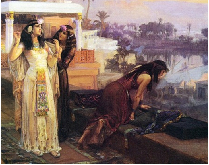
Nữ hoàng Ai Cập Cleopatra - người nổi tiếng vì vẻ đẹp của mình

Các nhà nghiên cứu đã tái tạo lại một loại nước hoa Ai Cập được cho là chính Cleopatra sử dụng. Nước hoa này có tên Mendesian đồng thời được mô tả là ngọt ngào, cay và hương thơm dịu, mềm mại. Cleopatra đã sử dụng nước hoa để tăng thêm sự quyến rũ của mình.