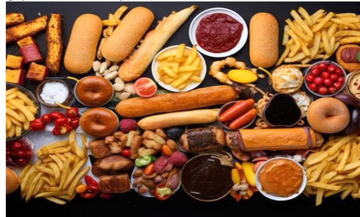
Thực phẩm siêu chế biến làm tăng nguy cơ mắc bệnh thận mạn