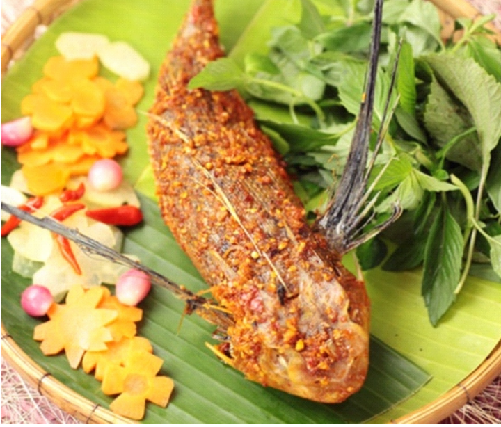
Cá thòi lòi nướng muối ớt ngon trứ danh

Loài cá này có hình thù gần giống với cá bống sao nhưng da xù xì và hai mắt lồi to trên chóp đầu, có thể trườn trên nước, bò nhanh trên mặt đất, thậm chí leo cây.