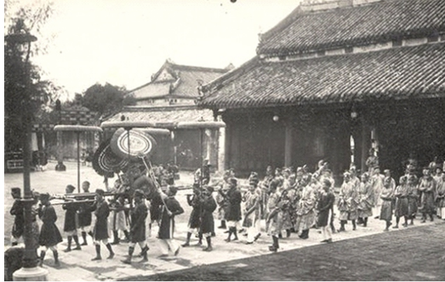
Nghi lễ đón tết trong cung đình ngày xưa

N gay từ khi đất nước vừa mới giành được độc lập, các triều đại phong kiến đầu tiên của nước ta đã rất coi trọng dịp Tết với nhiều hoạt động ý nghĩa.