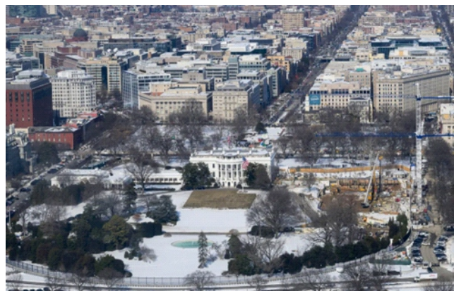
Nhà Trắng nhìn từ Đài tưởng niệm Washington, ngày 4/2/2026

Báo cáo cũng nhắc tới những tranh cãi xung quanh các khoản đóng góp lớn cho các đảng phái chính trị, cũng như chỉ trích liên quan đến việc bổ nhiệm chức vụ đối với các nhà tài trợ. Transparency International cảnh báo Anh có nguy cơ tiếp tục “sa lầy trong bê bối” nếu không có các biện pháp cải cách mạnh mẽ nhằm khôi phục niềm tin công chúng.