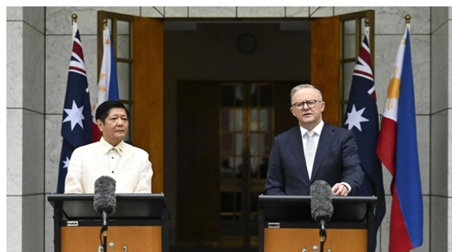
Tổng thống Philippines Ferdinand Marcos (trái) thăm Australia tháng 2/2024 và họp báo chung với Thủ tướng Anthony Albanese