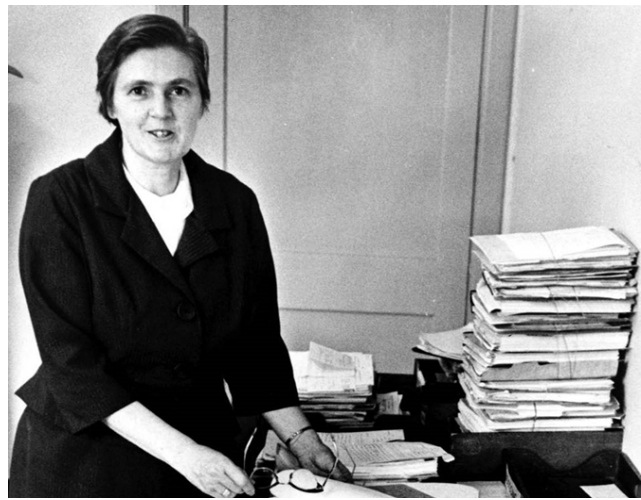
Tiến sĩ Frances Kelsey

Năm 1960, nước Mỹ đã gặp một sự may mắn. Không phải may vì thành tựu quan trọng nào đó hay tránh được thiên tai, bão lũ. Nhưng nó còn quý giá hơn cả, là bởi một thảm họa kinh hoàng đã được ngăn chặn kịp thời. Tất cả nhờ công của một người phụ nữ.