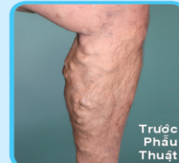
Trước Phẫu Thuật