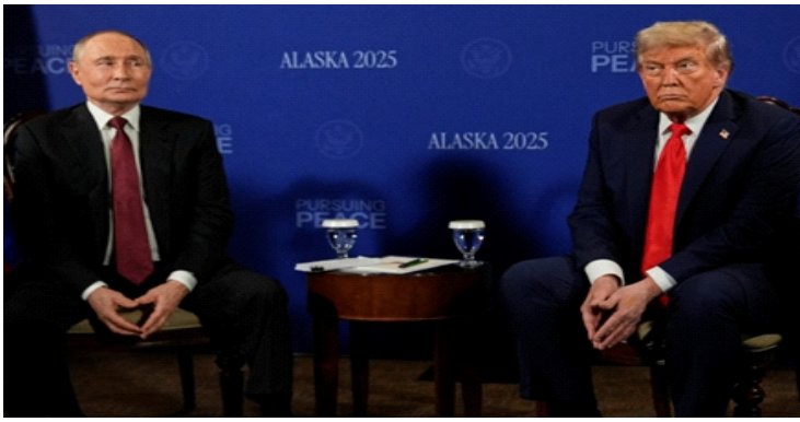
Tổng thống Putin và Tổng thống Trump trong cuộc hội đàm tại Alaska, Mỹ hồi tháng 8/2025

Ngày càng nhiều tàu chở dầu thô Nga phải nằm chờ trên các vùng biển khắp thế giới. Theo ước tính của Reuters, khoảng 19 triệu thùng dầu Urals chuyển lên tàu trước ngày 15/12/2025 vẫn chưa được giải phóng, khi các nhà giao dịch chật vật tìm người mua trong bối cảnh nhu cầu suy giảm. Tình trạng dư cung dầu toàn cầu đã kéo giá dầu giảm trên diện rộng.