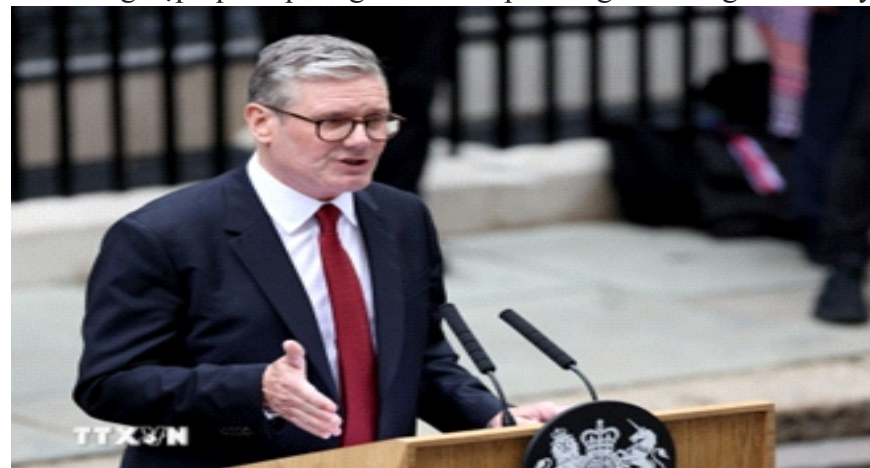
Thủ tướng Anh Keir Starmer phát biểu tại thủ đô London

(EU), trong bối cảnh London tìm cách tăng cường hợp tác an ninh-quốc phòng với châu Âu, bắt chấp những bất đồng trước đây