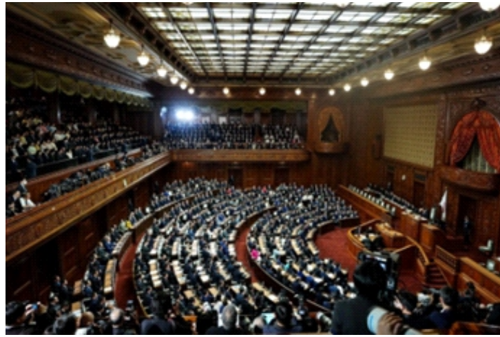
Toàn cảnh phiên họp toàn thể của Hạ viện Nhật Bản ở Tokyo, ngày 23/1/2026

Ở phía đối lập, Liên minh Cải cách trung dung xây dựng thông điệp đặt đời sống dân thường làm trung tâm, cam kết giảm hoặc miễn thuế thực phẩm đi kèm minh bạch ngân sách. Tuy nhiên điểm yếu của liên minh không nằm ở nội dung chính sách mà ở khả năng biến chính sách thành quyền lực.