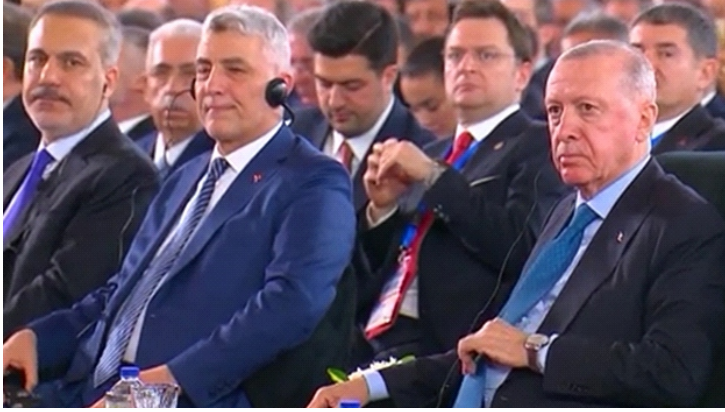
Tổng thống Thổ Nhĩ Kỳ Recep Tayyip Erdogan (bên trái)

Ai Cập và Thổ Nhĩ Kỳ nhất trí mở rộng sản xuất chung trong các lĩnh vực ưu tiên, thúc đẩy chuyên gia công nghệ và phát triển kỹ năng, cũng như tăng cường hợp tác trong lĩnh vực năng lượng tái tạo, hydro xanh, năng lượng hạt nhân, chuyển đổi xanh và các ngành công nghiệp phát thải carbon thấp, cũng như trong lĩnh vực hydrocarbon và khai khoáng.