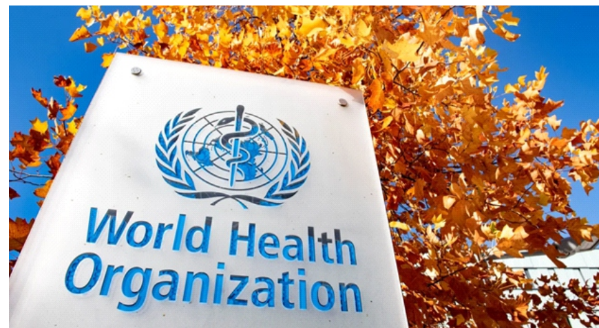
Hình chụp bằng trụ sở WHO

giảm mức độ tham gia, với lý do liên quan đến phản ứng ban đầu của WHO trước đại dịch COVID-19 và yêu cầu cải cách sâu rộng tổ chức. Cùng với tình