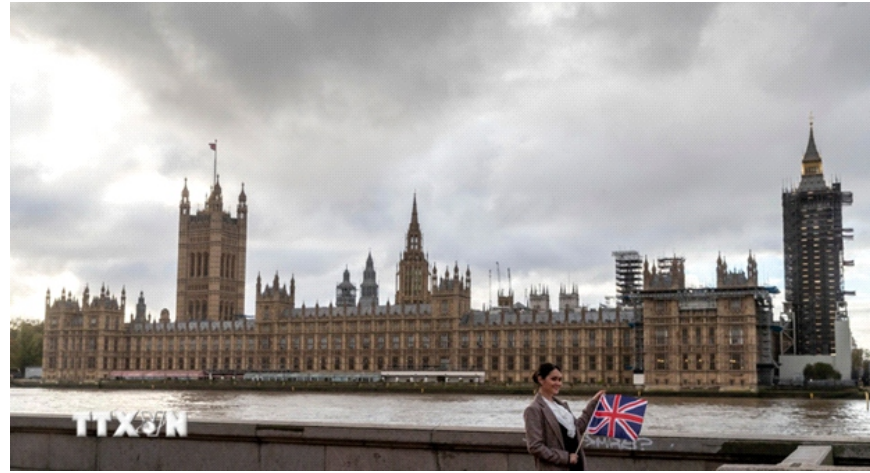
Trụ sở Quốc hội Anh tại thủ đô London

tới gần 40 tỷ bảng Anh (gần 55 tỷ USD) và thời gian thi công kéo dài hơn 60 năm, nếu các nghị sỹ