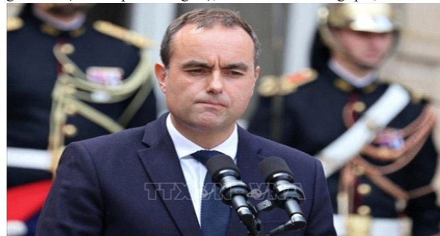
Thủ tướng Pháp Sebastien Lecornu

Diễn biến này đồng nghĩa với việc dự thảo ngân sách được chính thức thông qua, chấm dứt