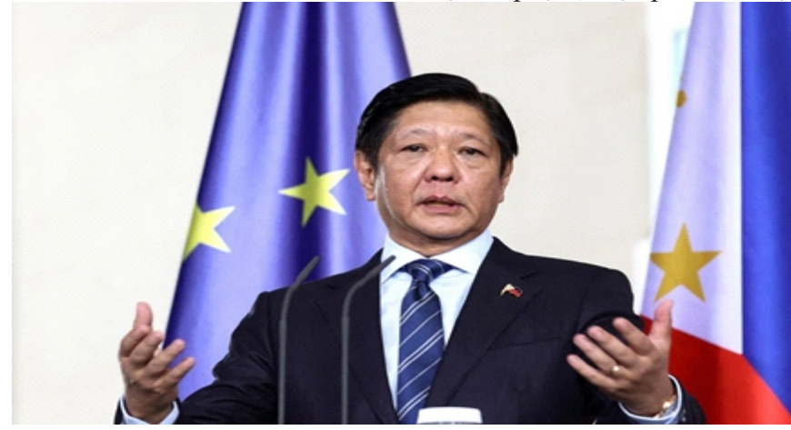
Tổng thống Philippines Ferdinand Marcos Jr

Ông Marcos, người đang ở giữa nhiệm kỳ tổng thống kéo dài sáu năm và kiên quyết phủ nhận mọi sai phạm, hiện phải đối mặt