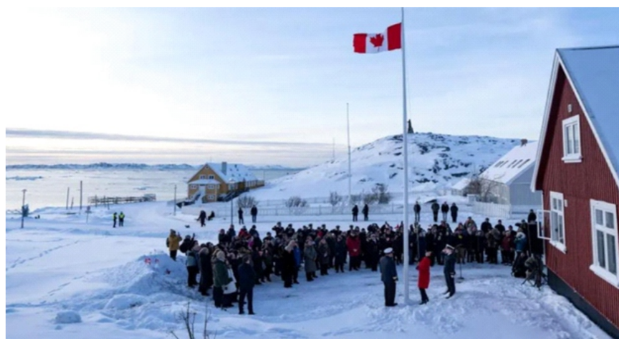
Bộ trưởng Ngoại giao Anita Anand, ở vị trí trung tâm phía trước, giúp kéo cờ Canada tại lãnh sự quán Canada mới ở Nuuk, Greenland

Greenland, động thái được xem là sự thể hiện rõ ràng ủng hộ Đan Mạch và chính quyền Greenland trong bối cảnh Tổng thống Mỹ Donald Trump nhiều lần bày tỏ