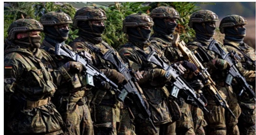
Tàu phá băng CCGS Jean Goodwill của Lực lượng Bảo vệ bờ biển Canada tại Cảng Nuuk, Greenland, ngày 6/2/2026

đồng thời tăng cường hợp tác về an ninh và quốc phòng Bắc Cực với Greenland và Đan Mạch.