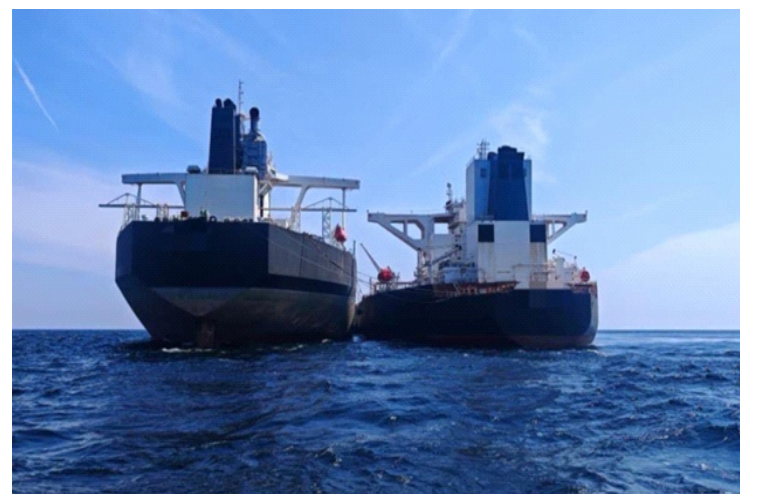
Hai tàu bị nghi chuyển lậu dầu thô ngoài khơi Malaysia trong ảnh chụp ngày 29/1

Hai tàu bị bắt ở khu vực cách mũi Muka, phía tây Malaysia, khoảng 44 km khi chở lượng dầu thô trị giá gần 130 triệu USD. Trên các phương tiện có tổng cộng 53 thủy thủ là công dân Ấn Độ, Iran, Myanmar, Pakistan và Trung Quốc.