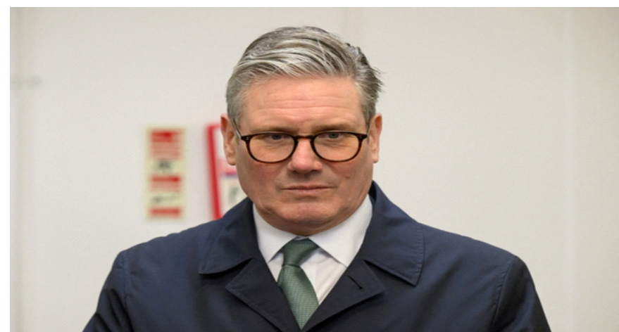
Thủ tướng Anh Keir Starmer

kết thúc chóng vánh vào tháng 9/2025, sau 7 tháng làm việc, sau khi quan hệ giữa ông với tỷ phú ái dâm Jeffrey Epstein được hé