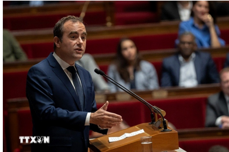
Thủ tướng Pháp Sebastien Lecornu phát biểu trước Quốc hội ở Paris

Năm ngoái, ông từng cam kết sẽ nỗ lực tìm kiếm sự chấp thuận của Quốc hội nhằm tránh "vết xe đổ" của hai nhà lãnh đạo tiền nhiệm - những người đã bị bãi miễn do các bê bối trong đàm phán ngân sách.