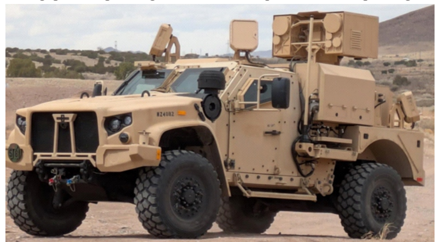
Hệ thống laser Locust gắn trên xe trong ảnh đăng tháng 12/2025

an ninh đặc biệt". Hạn chế được gỡ bỏ sau hơn 7 tiếng, FAA cho biết "không có mối đe dọa nào" đối với hàng không thương mại. Các quan chức địa phương và