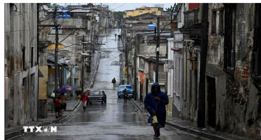
Khu vực Santiago de Cuba, Cuba

ng nghiêm trọng, đồng thời chỉ trích các đe dọa áp thuế của Mỹ đối với những quốc gia cung cấp dầu mỏ cho La Habana là "rất bất