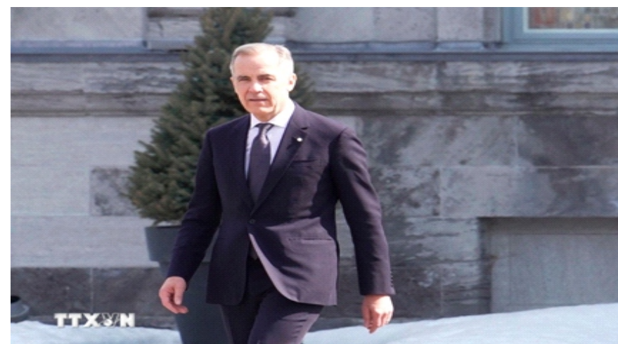
Thủ tướng Canada Mark Carney

Ông Carney sẽ khởi hành đến Hội nghị An ninh Munich, trở thành Thủ tướng Canada đầu