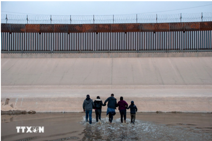
Người di cư vượt sông Rio Bravo ở biên giới Mỹ-Mexico

Bộ An ninh Nội địa Mỹ (DHS) cho biết nước này đã bắt giữ hoặc tạm giam hơn 21.400 người nhập cư trái phép vì các hành vi phạm pháp nghiêm trọng, trong một năm kể từ khi Tổng thống Donald Trump ký ban hành luật Laken Riley và đưa vào thực hiện.