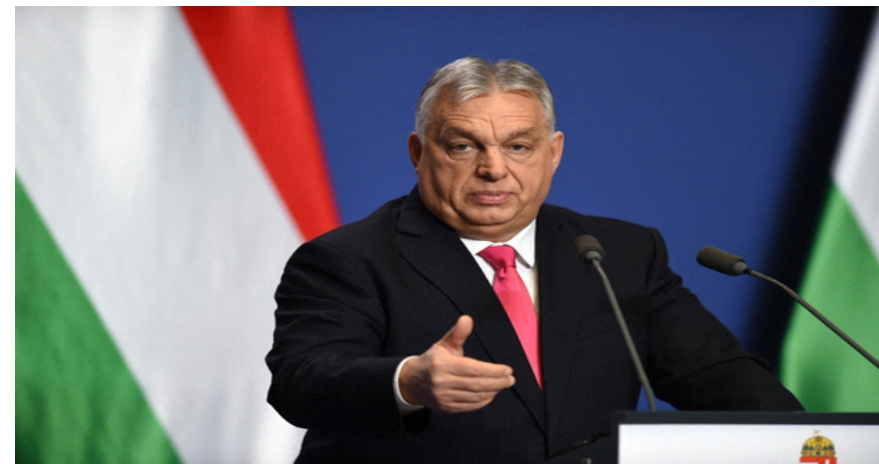
Thủ tướng Hungary Viktor Orban tại Budapest ngày 5/1

Orban tuyên bố trong cuộc mít tinh. "Bất cứ ai nói điều này đều là kẻ thù của Hungary, do đó