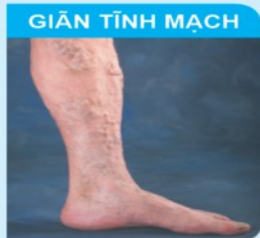
GIÃN TĨNH MẠCH