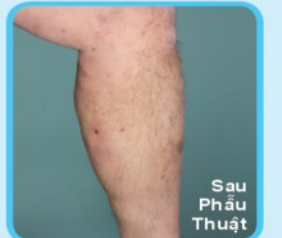
Sau Phẫu Thuật