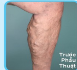
Trước Phẫu Thuật