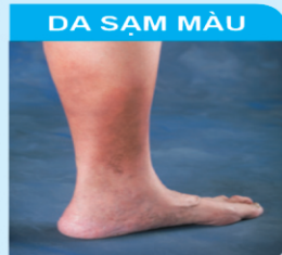
DA SẠM MÀU