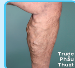
Trước Phẫu Thuật