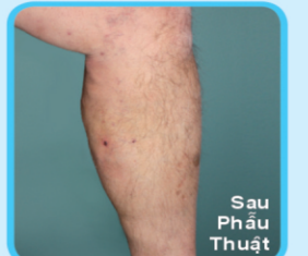
Sau Phẫu Thuật