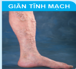
GIÃN TĨNH MẠCH