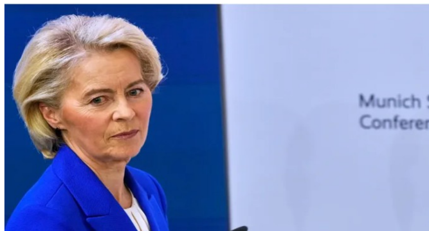
Chủ tịch Ủy ban châu Âu Ursula von der Leyen

Bài đăng trên X của bà von der Leyern dường như báo hiệu