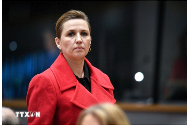
Thủ tướng Đan Mạch Mette Frederiksen tới dự Hội nghị thượng đỉnh đặc biệt của Liên minh châu Âu (EU) tại Brussels (Bi) ngày 6/3/2025

Phát biểu trước Quốc hội (Folketing), bà Frederiksen thông báo: “Tôi đã đề nghị Nhà Vua kêu gọi tổ chức bầu cử Quốc hội”.