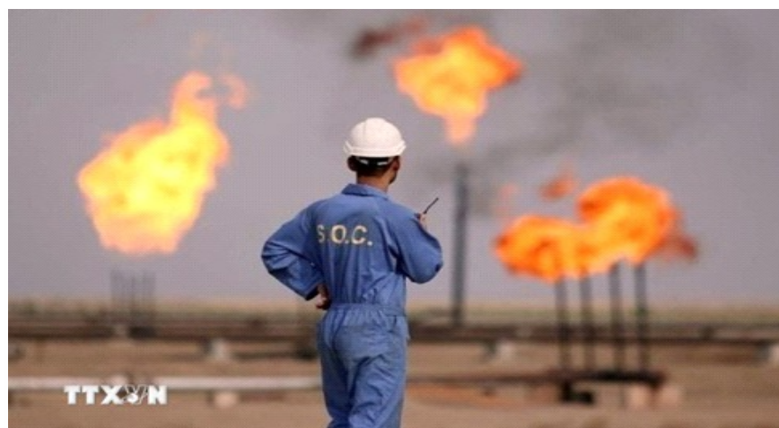
Một cơ sở khai thác dầu của Iran

Động thái này nhằm ứng phó với tình trạng gián đoạn vận tải biển nghiêm trọng tại khu vực Trung Đông sau các diễn biến quân sự mới nhất giữa Mỹ - Israel