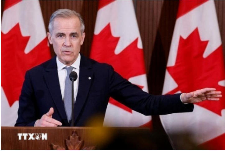
Thủ tướng Canada Mark Carney phát biểu tại một cuộc họp báo ở Ottawa

Chặng dừng chân cuối cùng tại Nhật Bản cho thấy vai trò trung tâm của Tokyo trong chiến lược châu Á của Canada. Nhật Bản hiện là một trong những nhà đầu tư lớn nhất vào Canada và là đối tác quan trọng trong Hiệp định Đối tác Toàn diện và Tiến bộ xuyên Thái Bình Dương (CPTPP).