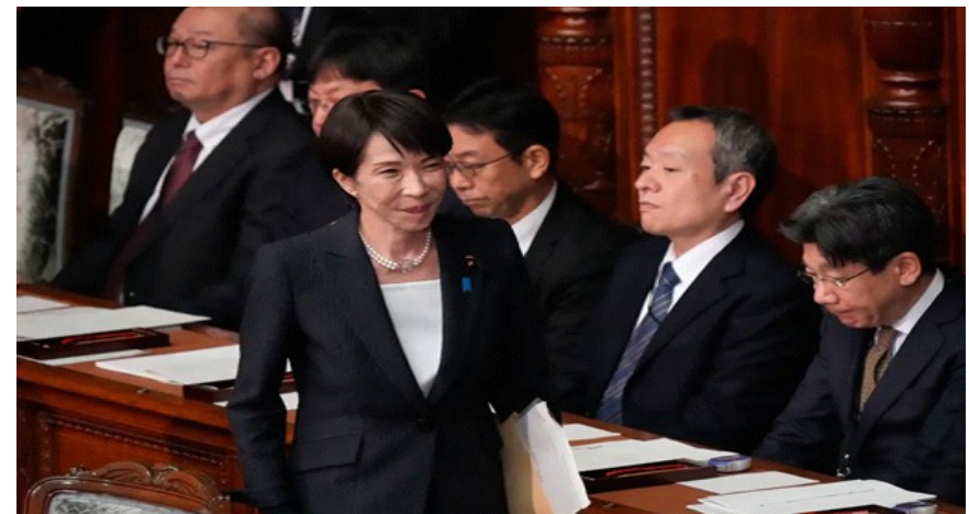
Thủ tướng Nhật Bản Sanae Takaichi

trong Hoàng thất” được đánh giá là phù hợp. “Chính phủ và cá nhân tôi tôn trọng báo cáo này”, bà nhấn mạnh.