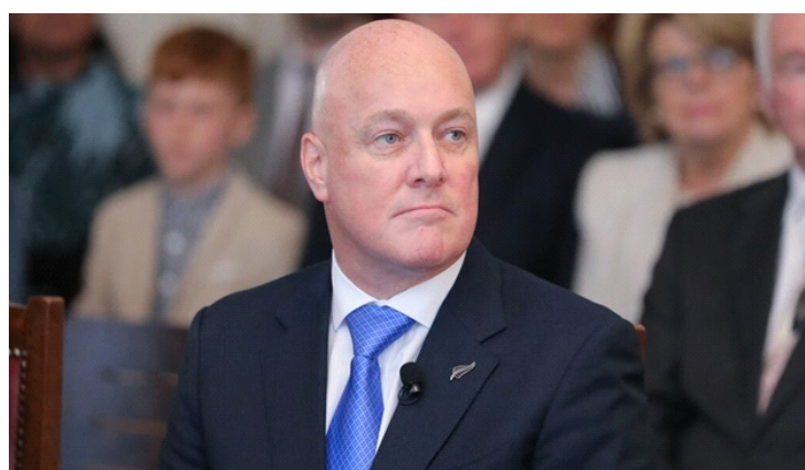
Thủ tướng Luxon

Không chỉ vậy, mức tín nhiệm cá nhân của Thủ tướng Luxon cũng giảm 1 điểm, xuống còn 21%, trong khi mức tín nhiệm dành cho lãnh đạo Công đảng New Zealand đối lập, ông Chris Hipkins, tăng 4,7 điểm, lên 22,7%. Đây là lần thứ hai kể từ khi nhậm chức, mức tín nhiệm của Thủ tướng Luxon thấp hơn so với lãnh đạo Công đảng đối lập.