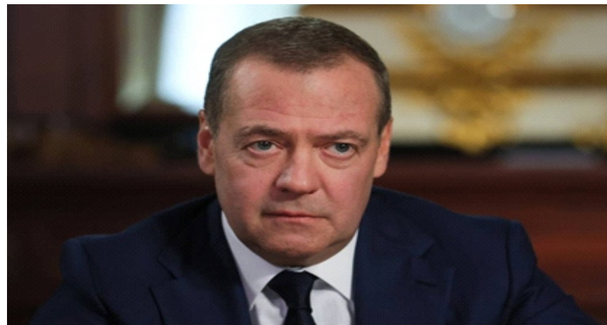
Phó chủ tịch Hội đồng An ninh Nga Dmitry Medvedev

Theo ông, Washington "chỉ lợi dụng" các nước Vùng Vịnh làm nơi đặt căn cứ để "bảo vệ