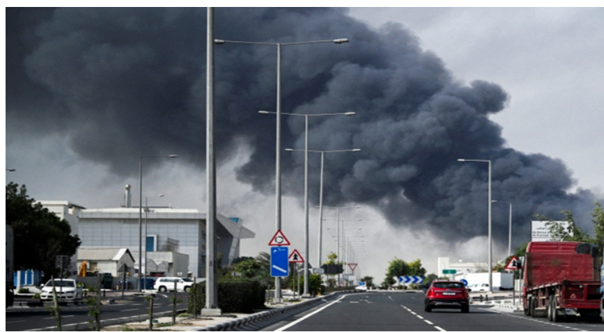
Khói đen do cuộc không kích của Iran bốc lên ở Doha, Qatar, ngày 1/3

bị tấn công", Thủ tướng kiêm Ngoại trưởng Qatar Mohammed bin Abdulrahman bin Jassim Al Thani bình luận về những đòn tập kích vừa qua từ Iran.