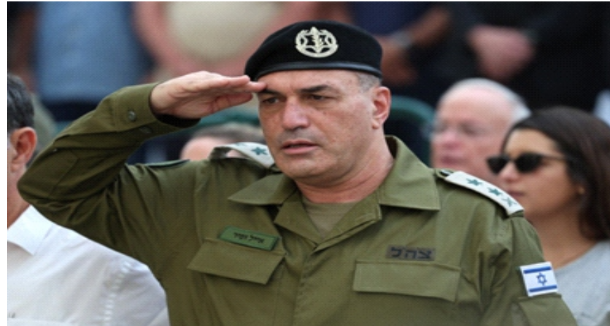
Tổng tham mưu trưởng Lực lượng Phòng vệ Israel Eyal Zamir tại một sự kiện ở thành phố miền trung Kfar Saba tháng 11/2025

Shabbat là ngày nghỉ lễ hàng tuần của người Do Thái, thường dành cho gia đình và sinh hoạt