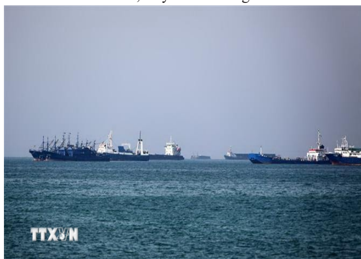
Tàu chở dầu hướng về eo biển Hormuz

Theo DFC, chương trình tái bảo hiểm của Mỹ sẽ được triển khai theo từng giai đoạn, trước mắt tập trung vào bảo hiểm thân tàu, máy móc và hàng hóa.