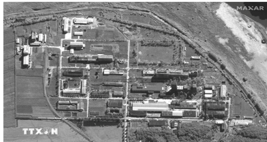
Hình ảnh do vệ tinh Maxar cung cấp về cơ sở hạt nhân Yongbyon của Triều Tiên

Ông Chung Dong Young đưa ra thông tin trên trong phiên