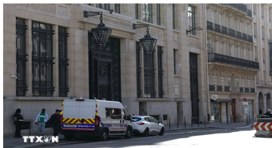
Xe cảnh sát được triển khai bên ngoài ngân hàng Bank of America ở Paris, Pháp, ngày 28/3/2026

thủ đô Paris của nước này. Theo truyền thông Pháp, sự việc xảy ra vào khoảng 3h30 (giờ địa phương, tức 8h30 giờ Việt Nam ngày 28/3) trước trụ sở của