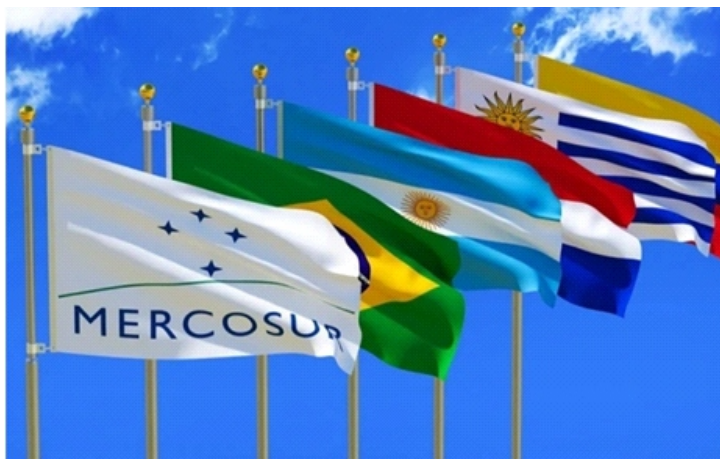
Colombia và Venezuela mong muốn gia nhập MERCOSUR

Hai bên cũng đạt thỏa thuận tổ chức cuộc họp về khu vực biên giới chung và tăng cường phối hợp quân sự nhằm chống các nhóm buôn bán ma túy hoạt động dọc biên giới.