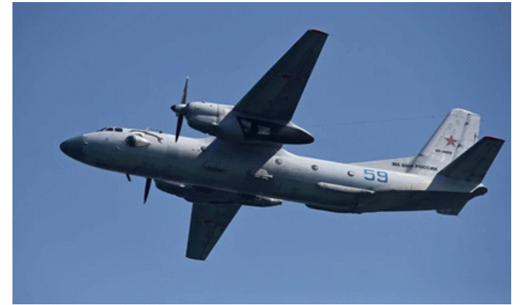
Máy bay quân sự Antonov-26 của Nga

“Vào khoảng 18h ngày 31/3 theo giờ Moscow, liên lạc với máy bay vận tải quân sự An-26 đã bị mất khi máy bay này đang thực hiện chuyến bay theo lịch trình trên bán đảo Crimea” - Bộ Quốc phòng Nga thông báo.