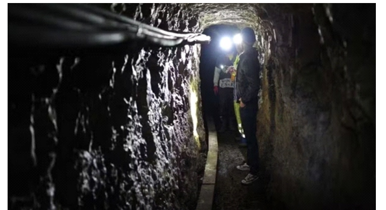
Sau hơn một năm theo dõi, lực lượng an ninh đã thực hiện chiến dịch và đạt được kết quả đáng chú ý: 17 tấn nhựa cần sa (hashish) bị thu giữ

Thay vì sử dụng thuyền cao tốc để chở hàng vượt qua eo biển Gibraltar, nơi bị kiểm soát chặt chẽ, chúng đã đầu tư xây dựng hạ tầng ngầm kiên cố nhằm đối phó với lực lượng an ninh.