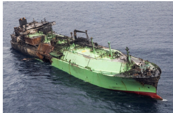
Lực lượng tuần duyên Libya kéo tàu chở dầu Nga tới vùng biển quốc tế để dỡ hàng ngày 25/3

"Chúng tôi trấn an người dân trên khắp Libya nói chung và các khu vực ven biển phía tây nói riêng, đặc biệt là Zuwara và Sabratha, rằng các cơ quan chức năng liên quan đang nỗ lực hết sức để xử lý tình hình", ông Tuwair nói. Chính quyền hiện vẫn chưa tiết lộ con tàu sẽ được lai dắt về đâu.