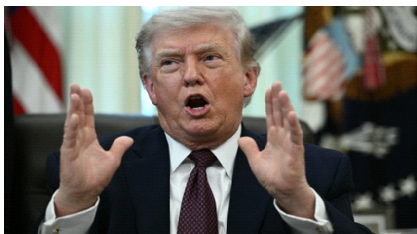
Tổng thống Mỹ Donald Trump tại Nhà Trắng ngày 31/3

hôm nay cho hay, khi được hỏi liệu ông có xem xét lại việc để Mỹ tiếp tục là thành viên của liên minh quân sự này sau khi xung đột Trung Đông kết thúc hay