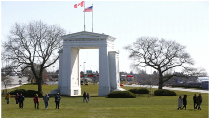
Khu vực biên giới giữa Seattle, bang Washington, Mỹ và Surrey, British Columbia, Canada