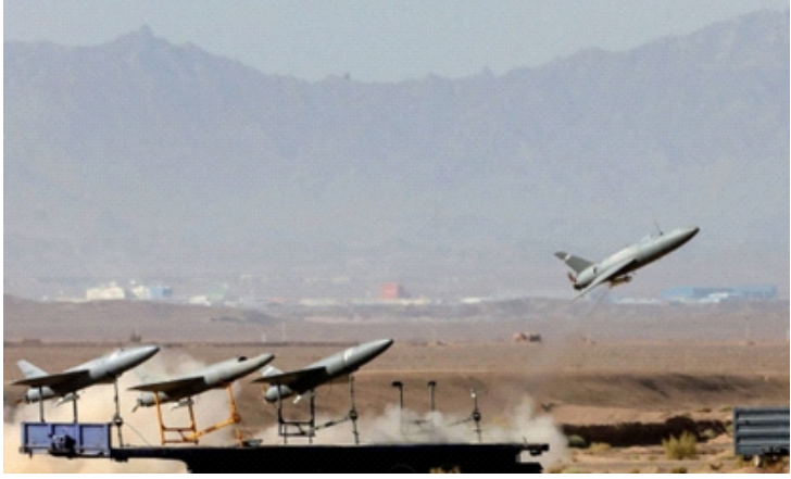
UAV được phóng trong một cuộc tập trận ở Iran hồi tháng 8/2022

Trong video, máy bay không người lái (UAV), dường như được điều khiển bằng cáp quang, lượn lơ trên một căn cứ của Mỹ ở Baghdad. Sau đó, chúng bất ngờ lao xuống tấn công mục tiêu dưới mặt đất, trong đó có một trực thăng Black Hawk và hệ thống radar phòng không.