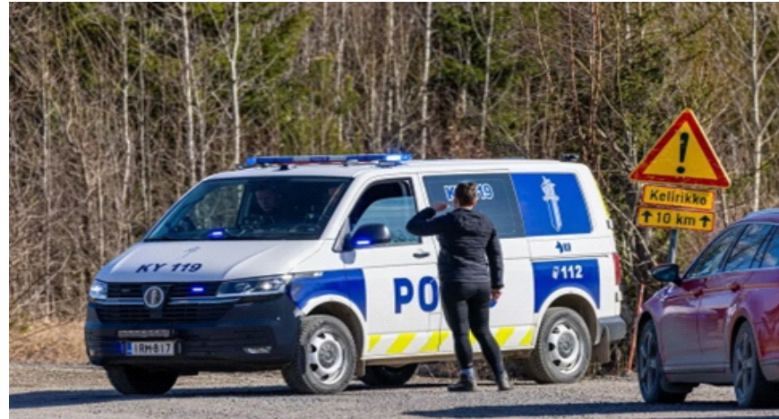
Xe cảnh sát phong tỏa đường sau khi 2 UAV không xác định xâm nhập và rơi xuống Kouvola, Phần Lan, ngày 29/3/2026

Nam nước này. Cụ thể, 1 máy bay không người lái không xác định đã rơi xuống đất ở phía Bắc