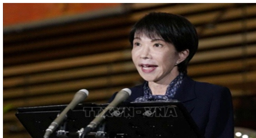
Thủ tướng Nhật Bản Sanae Takaichi phát biểu tại thủ đô Tokyo

luận dự thảo ngân sách tài khóa 2026 bị trì hoãn một tháng so với các năm trước.