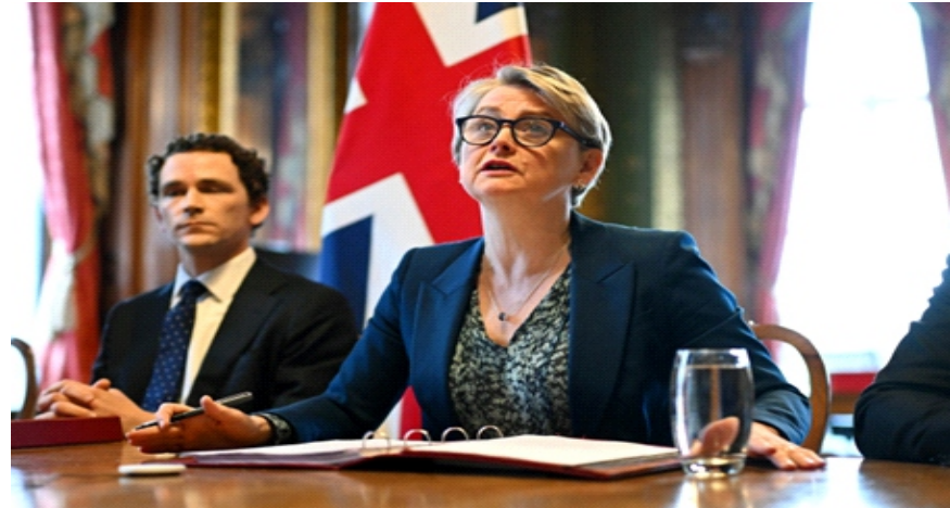
Ngoại trưởng Anh Yvette Cooper phát biểu tại hội nghị trực tuyến về mở cửa lại eo biển Hormuz với hơn 40 quốc gia tại London ngày 2/4

luyện các chiến lược để mở lại eo biển Hormuz. Tuyên huyết mạch dầu mỏ của thế giới này đang bị