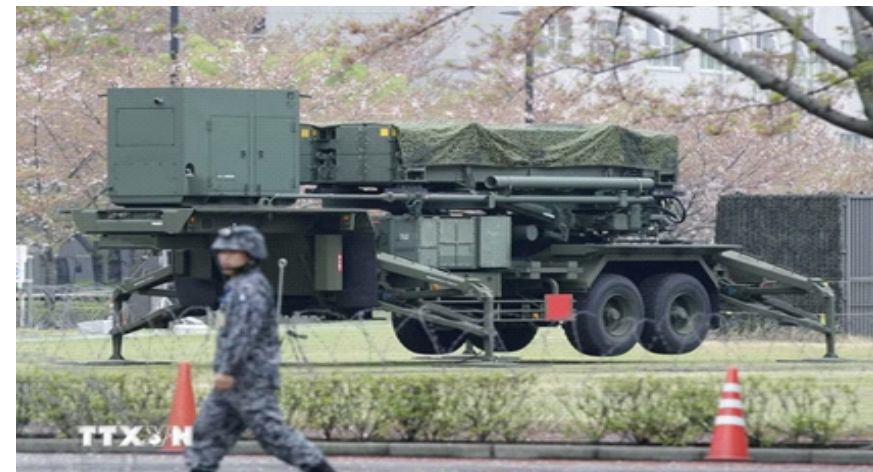
Tên lửa Patriot Advanced Capability-3 tại trụ sở Bộ Quốc phòng Nhật Bản ở thủ đô Tokyo

(VN+) - Nhật Bản hướng tới xây dựng một cơ chế cho phép các cơ sở sản xuất dân sự có thể