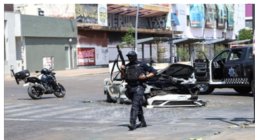
Cảnh sát gác tại Guadalajara, bang Jalisco, Mexico, ngày 22/2/2026

(VN+) - Thành phố Guadalajara (bang Jalisco, Mexico) chuẩn bị đăng cai World Cup 2026 trong bối cảnh vừa trải qua bất ổn bạo lực, khi chính