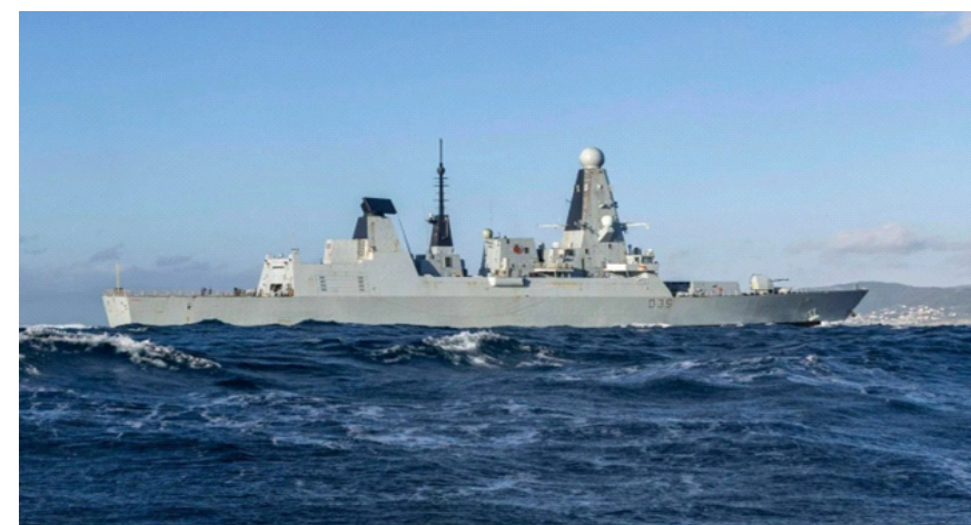
Tàu khu trục HMS Dragon trên đường tới Cyprus hồi tháng 3

(VNE) - Khu trục hạm phòng không HMS Dragon, được Anh điều tới bảo vệ căn cứ ở Cyprus, phải về cảng sửa chữa