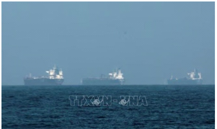
Tàu thuyền đậu ngoài khơi Fujairah, Các Tiểu vương quốc Arab Thống nhất (UAE) ngày 3/3/2026

Iran tiếp tục kiểm soát việc tiếp cận Eo biển Hormuz dù đã có lệnh ngừng bắn, với các chủ tàu vẫn phải xin phép theo các quy trình hiện có. Tính đến sáng 8/4, theo giờ địa phương, chưa có thay đổi chính thức nào được công bố, khiến nhiều nhà khai thác chưa sẵn sàng di chuyển ngay.