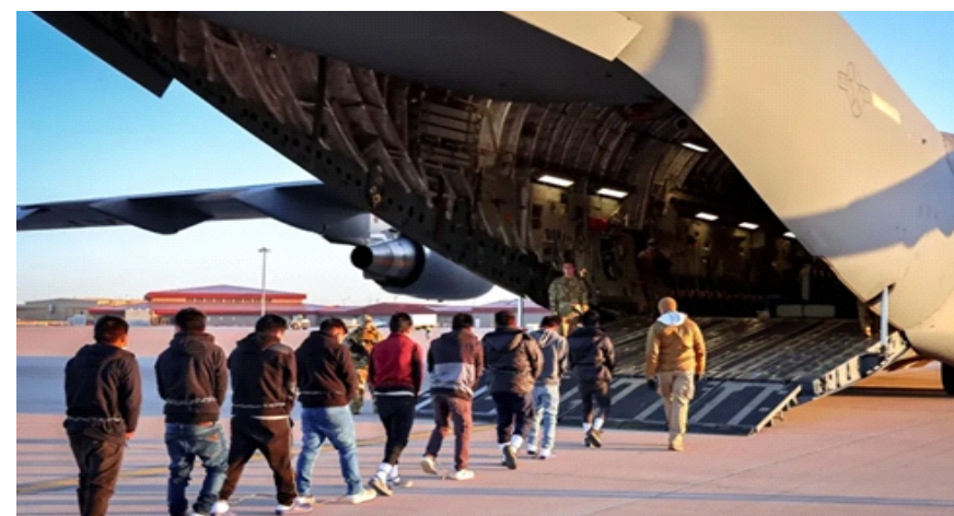
Hình ảnh chuyến bay trục xuất hồi tháng 1/2026 được Thư ký Báo chí Nhà Trắng Karoline Leavitt chia sẻ

(VN+) - Congo sẽ tiếp nhận người nhập cư nước thứ ba bị trục xuất từ Mỹ theo một thỏa thuận mới với chính quyền của Tổng