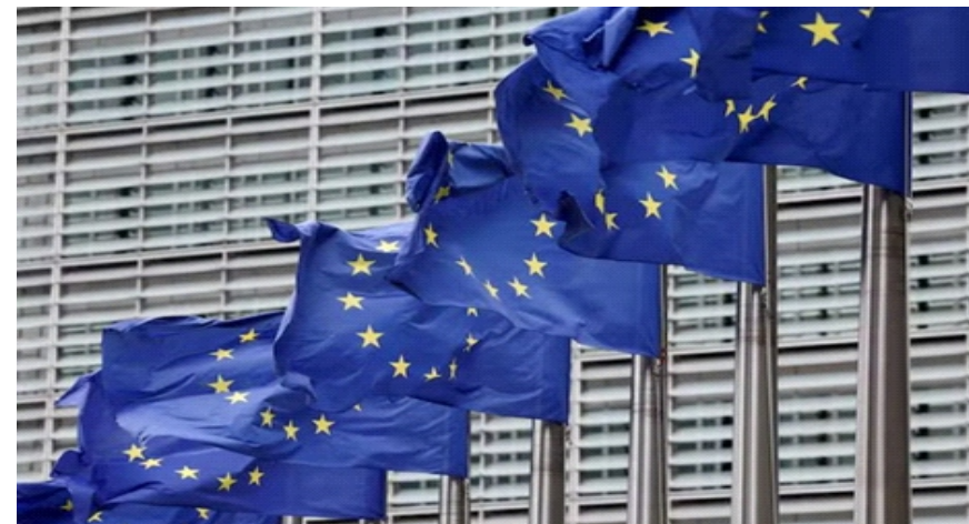
Cờ liên minh Châu Âu

(VN+) - Từ vị thế quốc gia đứng bên bờ vỡ nợ và suy tụt rời