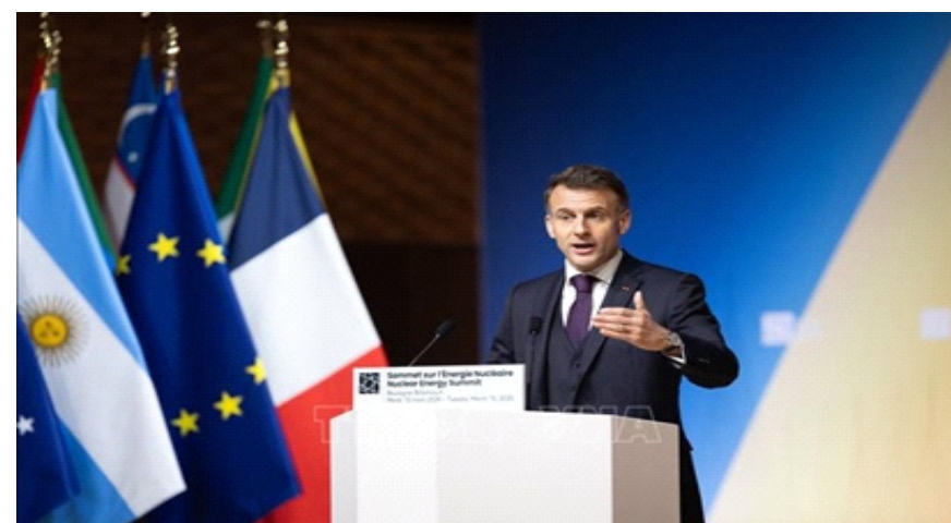
Tổng thống Pháp Emmanuel Macron

(VN+) - Các nhà lãnh đạo Pháp, Italy, Đức, Anh, Canada, Đan Mạch, Hà Lan, Tây Ban Nha và Liên minh châu Âu (EU) đã ra tuyên bố chung, hoan nghênh