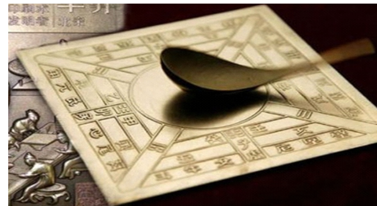
La bàn Trung Hoa cổ đại

La bàn là phát minh quan trọng nhất trong lịch sử lữ hành. Nếu không có la bàn, việc tìm đường trên biển và khám phá những vùng đất mới sẽ trở thành những việc bất khả thi. Và cũng chính người Trung Quốc đã phát minh ra chiếc la bàn đầu tiên vào thời nhà Hán.