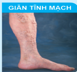
GIÃN TĨNH MẠCH