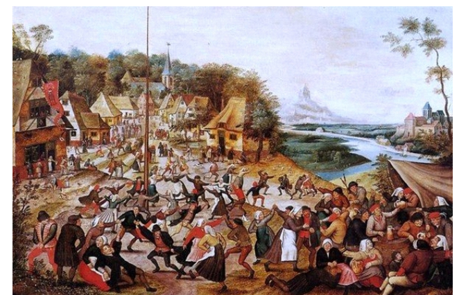
Tranh minh họa cảnh dân làng Strasbourg nhảy múa điên cuồng của Pieter Bruegel (con)

Trên thực tế, chưa có lời giải đáp chính xác hoàn toàn cho dịch bệnh nhảy múa. Trở lại với năm 1518, thấy những sân khấu gỗ không đem lại hiệu quả, nhà cầm quyền đã ra lệnh cấm hàng loạt tệ nạn bao gồm cờ bạc, mại dâm như một cách sám hối.