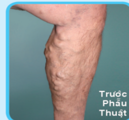
Trước Phẫu Thuật