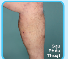
Sau Phẫu Thuật