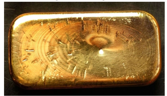
Vàng không bị xỉn bởi các lớp oxit trên bề mặt như đồng và bạc

thành hình dạng mới mà không đứt vỡ tới mức nào. Trong khi các kim loại khác vỡ thành nhiều mảnh khi đập quá mức nào đó, 28 g vàng có thể rèn thành phiến với mỗi cạnh dài 5 m. Lá vàng có thể mỏng tới 0,000127 mm, mỏng hơn khoảng 400 lần so với sợi tóc người, theo Phòng thí nghiệm Jefferson ở Newport News, Virginia.