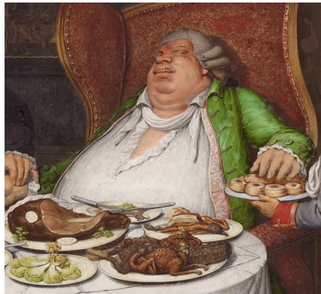
Tranh minh họa vẽ Tarrare của Gustave Doré

Giải thích đầu tiên là Tarrare bị nhiễm sán dây. Sán dây ăn thức ăn của vật chủ. Nhưng giả thiết này không giải thích được tại sao Tarrare lại ăn những đồ vật không ăn được hoặc tại sao anh ta lại ăn nhiều đồ ăn như vậy.