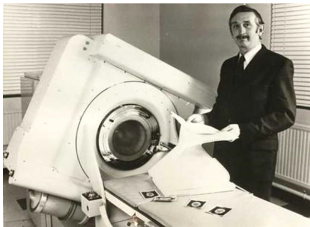
Nhà phát minh Godfrey Hounsfield đứng bên cạnh chiếc máy quét EMI đầu tiên vào năm 1972

Khoảng giữa thập niên 1960, kỹ sư người Anh Godfrey Hounsfield đã cân nhắc trong việc tìm hiểu liệu người ta có thể tìm thấy những khu vực ẩn bên trong các kim tự tháp Ai Cập bằng cách thu giữ những tia vũ trụ đi qua những chỗ trống không nhìn thấy được?