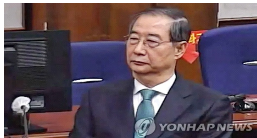
Cựu Thủ tướng Han Duck-soo