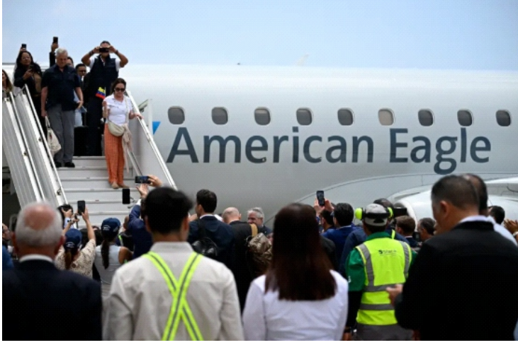
Hành khách cầm cờ Venezuela khi lên xuống máy bay của American Airlines

Chuyến bay của hãng hàng không American Airlines khởi hành từ thành phố Miami đã hạ cánh xuống sân bay thủ đô Caracas của Venezuela, trở thành chuyến bay thương mại đầu tiên giữa Mỹ và Venezuela hoạt động kể từ năm 2019. Sự kiện Mỹ nói lại chuyến bay thẳng đến Venezuela này đã được chào đón bằng những vệt nước phun ngang đường băng khi máy bay Mỹ bay qua.