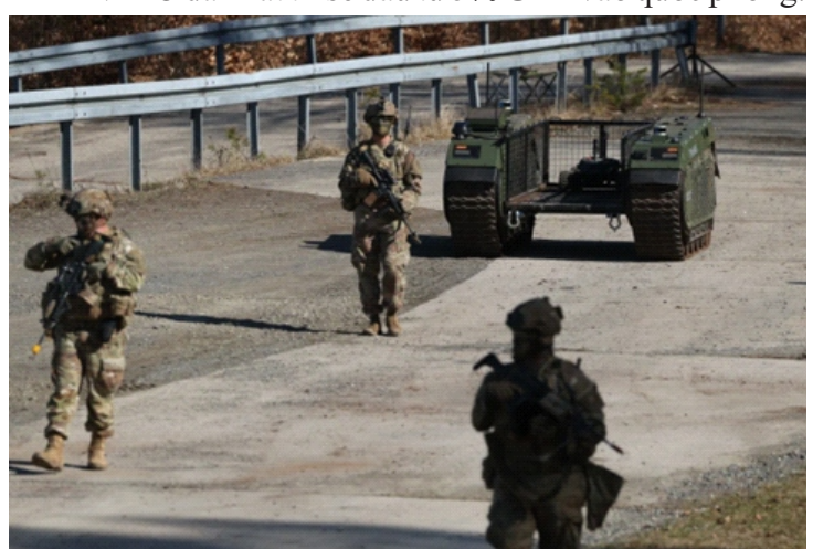
Các binh sĩ quân đội Mỹ tham gia huấn luyện tại Đức hồi tháng 3