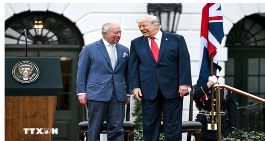
Nhà vua Anh Charles III (trái) và Tổng thống Mỹ Donald Trump tại cuộc gặp ở Washington, DC ngày 28/4/2026

Charles III và Hoàng hậu Camilla vừa kết thúc chuyến thăm cấp nhà nước 4 ngày tới Mỹ.