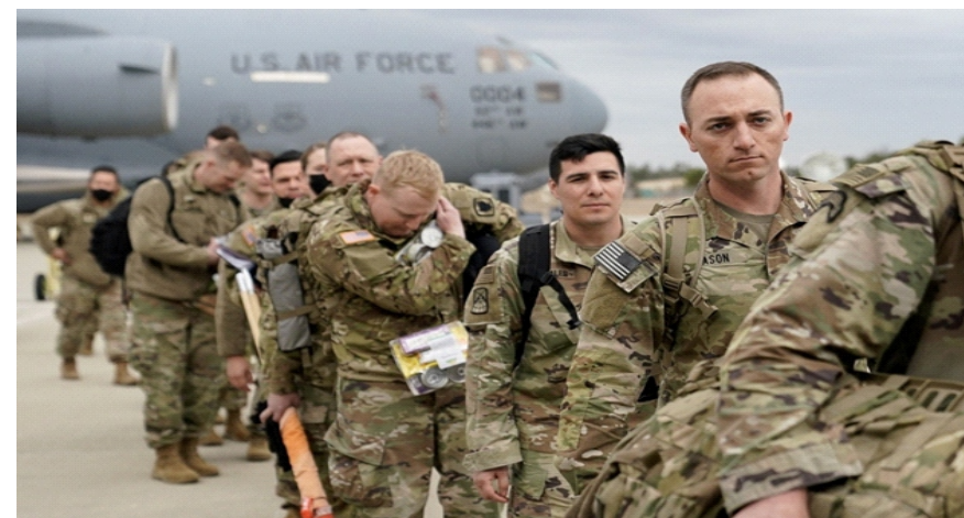
Quân đội Mỹ

Động thái này bao gồm việc rút một lữ đoàn tác chiến cùng các lực lượng khác đang đồn trú tại Đức. Tuy nhiên, quyết định trên dường như không ảnh