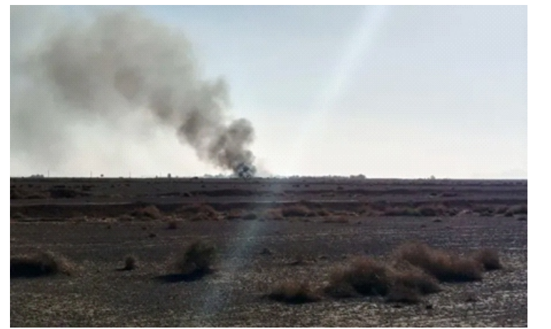
Khói bốc lên sau vụ không kích của Mỹ - Israel tại tỉnh Isfahan, Iran, tháng 4/2026

Iran là một bên tham gia Hiệp ước Không phổ biến vũ khí hạt nhân (NPT), và quá trình xem xét lại sau 5 năm đang được tiến hành tại trụ sở Liên hợp quốc. Theo các điều khoản của hiệp ước, Iran được yêu cầu mở cửa các cơ sở hạt nhân của mình cho IAEA kiểm tra - ông Grossi cho biết.