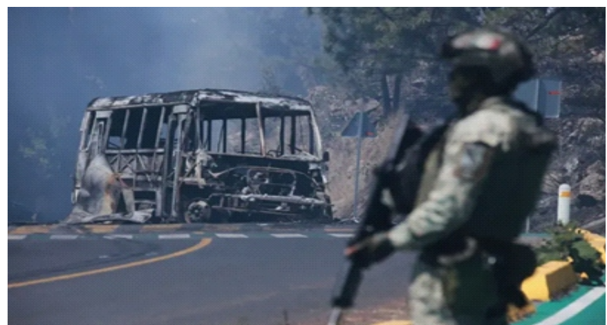
Hoạt động của các băng đảng buôn bán ma túy diễn ra khá mạnh tại Mexico - Ảnh minh họa

công bố các cáo buộc trong một thông cáo báo chí. Không ai trong số các bị cáo bị bắt giữ. Tuy nhiên, chính phủ Mexico ngay sau đó cho biết họ đã nhận được