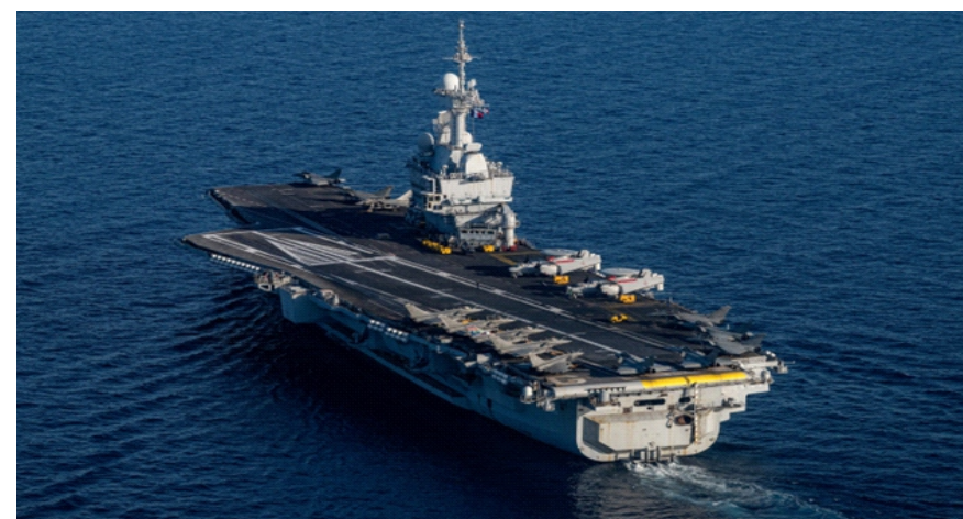
Tàu sân bay Charles de Gaulle vào cuối cuộc diễn tập của NATO ở ngoài khơi đảo Crete, Hy Lạp hôm 26/4

biết, đề cập sứ mệnh đa quốc gia do Tổng thống Emmanuel