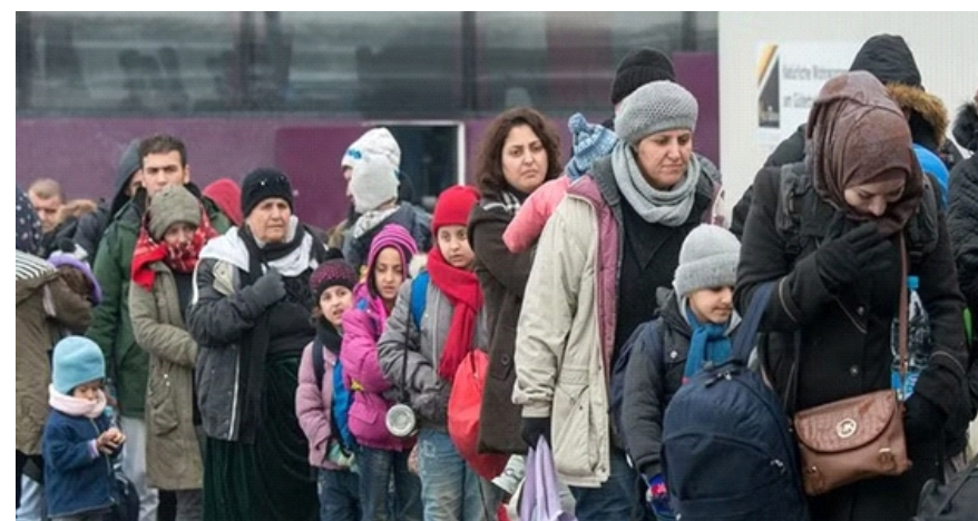
Người tị nạn xếp hàng tại ga xe lửa Passau, Đức

chưa đủ để giúp chính phủ liên bang cải thiện vị thế chính trị