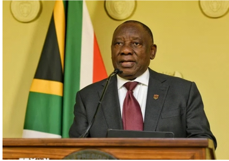
Tổng thống Nam Phi Cyril Ramaphosa

Giới quan sát nhận định cuộc bầu cử năm 2026 sẽ là bài kiểm tra quan trọng đối với uy tín của chính phủ liên minh hiện tại, trong bối cảnh các thách thức về hạ tầng điện nước và tỷ lệ thất nghiệp vẫn đang là những vấn đề cử tri quan tâm hàng đầu.