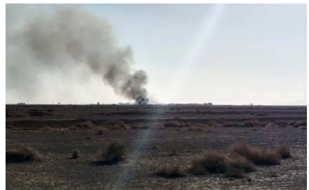
Khói bốc lên sau vụ không kích của Mỹ - Israel tại tỉnh Isfahan, Iran, tháng 4/2026

Cơ sở hạt nhân Isfahan tại Iran đã bị ném bom trong các cuộc không kích của Mỹ - Israel vào năm 2025 và phải đối mặt với các cuộc tấn công ít dữ dội hơn trong cuộc chiến tranh Mỹ - Israel trong năm nay. Tổng Giám đốc Cơ quan Năng lượng Nguyên tử Quốc tế (IAEA) Rafael Grossi cho biết trong một cuộc phỏng vấn rằng hình ảnh vệ tinh cho thấy tác động của các cuộc không kích mới nhất của Mỹ - Israel nhằm vào Iran.