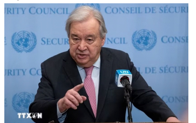
Tổng Thư ký Liên hợp quốc Antonio Guterres

Ông Guterres kêu gọi huy động thêm nguồn lực tài chính, cải tổ cấu trúc tài chính quốc tế và thúc đẩy đầu tư nhằm hỗ trợ châu Phi cũng như các nước đang phát triển thực hiện Chương trình nghị sự 2030 về phát triển bền vững.