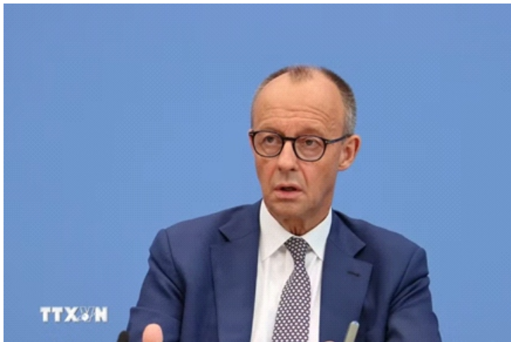
Thủ tướng Đức Friedrich Merz phát biểu trong một cuộc họp báo tại Berlin

Tại sự kiện ở Würzburg, Thủ tướng Đức nhấn mạnh khía cạnh kinh tế của các công nghệ chống biến đổi khí hậu, cho rằng cần tạo sự đồng thuận xã hội đối với chính sách bảo vệ khí hậu thông qua đổi mới công nghệ và mở rộng cơ hội phát triển cho doanh nghiệp. Ông khẳng định Chính phủ Đức sẽ không điều chỉnh các mục tiêu khí hậu đã đề ra.