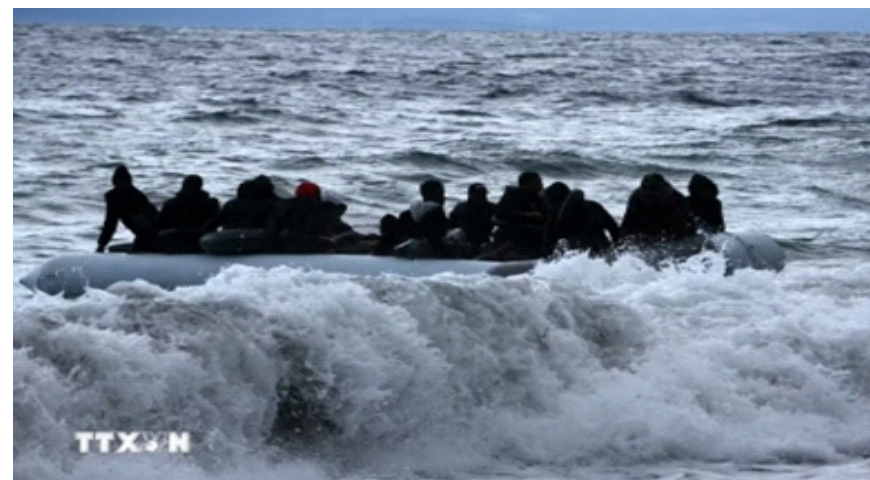
Người di cư trên thuyền ở ngoài khơi đảo Lesbos, Hy Lạp

Tuyên bố Chisinau được xem là một định hướng chính trị