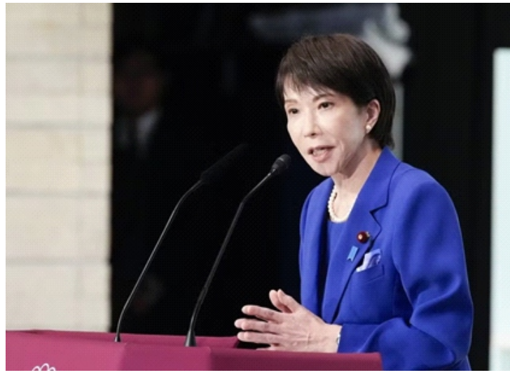
Thủ tướng Sanae Takaichi

Phát biểu tại hội thảo tổ chức ở Tokyo nhân dịp kỷ niệm 70 năm Nhật Bản gia nhập Liên hợp quốc, Ngoại trưởng Toshimitsu Motegi nhận định cải tổ Liên hợp quốc là "nhiệm vụ cấp bách", trong bối cảnh niềm tin đối với tổ chức này có dấu hiệu "lung lay" trước cơ chế xử lý các vấn đề địa chính trị toàn cầu.