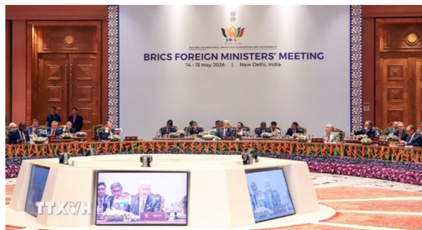
Hội nghị Ngoại trưởng BRICS tại New Delhi, Ấn Độ ngày 14/5/2026

giao, tôn trọng luật pháp quốc tế, đồng thời đảm bảo lưu thông thương mại hàng hải an toàn.