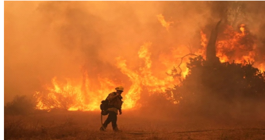
Hình Minh Họa

đáng kể. Diễn biến này được cho là có thể kéo theo hàng loạt tác động thời tiết cực đoan trên phạm vi toàn cầu.