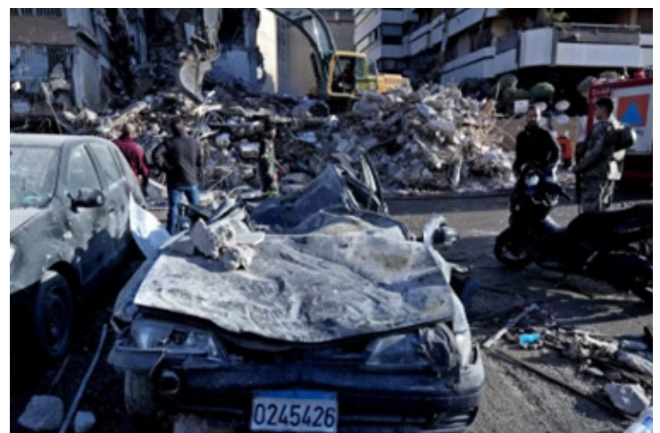
Cảnh đổ nát sau cuộc không kích của Israel tại Beirut, Liban

OCHA dẫn số liệu của chính quyền Liban cho hay một loạt vụ tấn công bằng thiết bị bay không người lái nhằm vào ôtô ở khu vực Jiyeh, cách thủ đô Beirut khoảng 20 km về phía Nam, đã khiến ít nhất 8 người thiệt mạng, trong đó có 2 trẻ em.