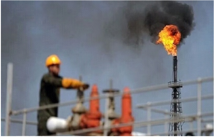
Cơ sở lọc dầu của Iran trên đảo Khark