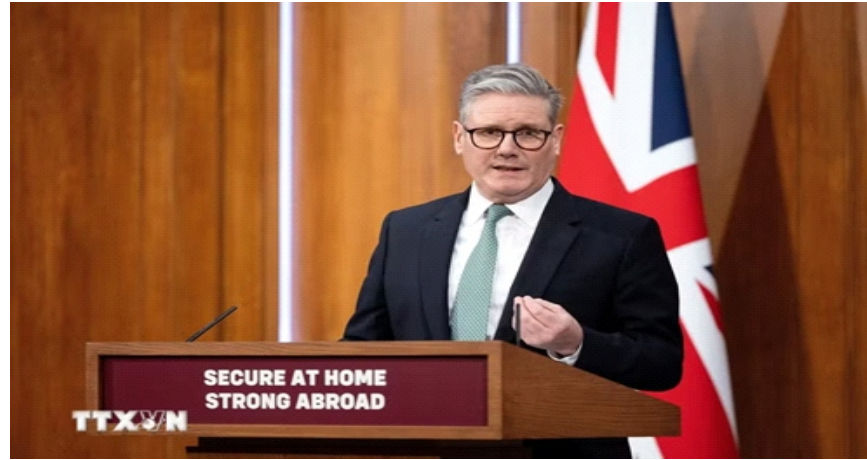
Thủ tướng Anh Keir Starmer

kiện cho Thị trưởng Great Manchester Andy Burnham thay thế ông tại khu vực bầu cử