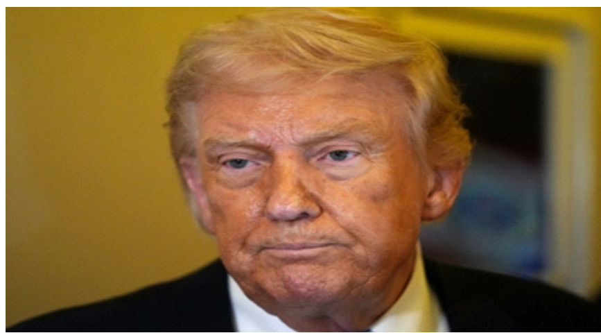
Tổng thống Mỹ Donald Trump trên chuyến cơ Không lực Một ngày 15/5

Trung Quốc luôn xem Đài Loan là phần lãnh thổ không thể tách rời và sẵn sàng sử dụng