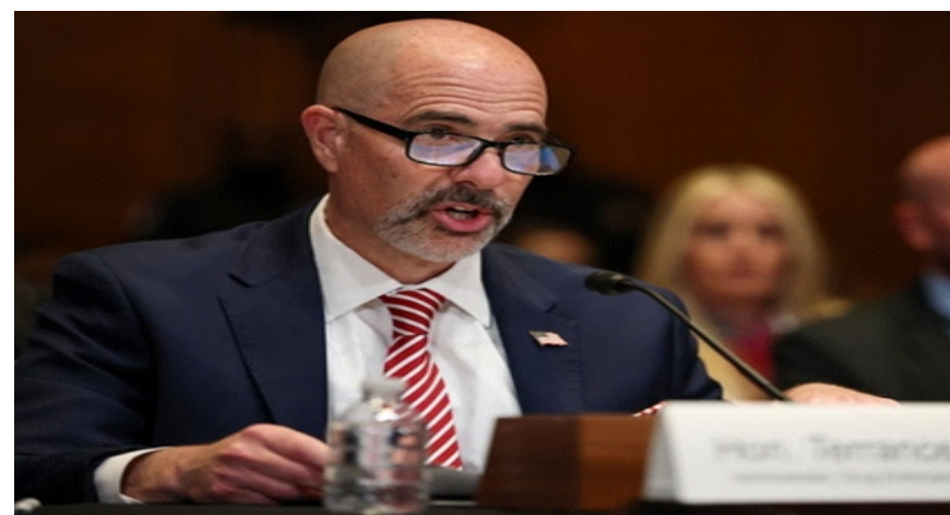
Giám đốc Cơ quan Phòng chống ma túy Mỹ Terry Cole phát biểu tại một phiên điều trần

Tại cuộc họp báo, Tổng thống Mexico Claudia Sheinbaum nói rằng nhiều người đang đặt cược vào thất bại của chính phủ Mexico. Bà khẳng định Mexico muốn duy trì quan