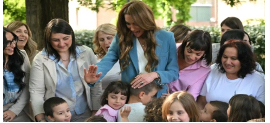
Công nương Kate ôm một em nhỏ khi thăm trường mầm non Anna Frank ở Reggio Emilia, Italy, ngày 13/5/2026

Emilia nổi tiếng với cách tiếp cận tiên phong trong giáo dục mầm non. “Phương pháp Reggio Emilia” nhấn mạnh sự sáng tạo, các mối quan hệ và học tập thông qua trải nghiệm thực tế. Cách tiếp cận này được phát triển sau Thế chiến II và sau đó