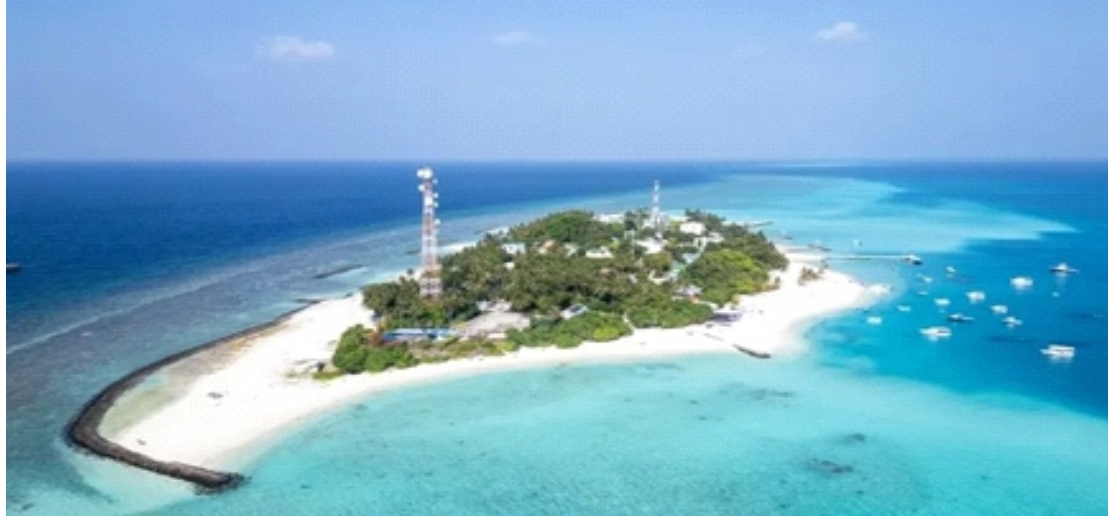
Toàn cảnh đảo Fulidhoo thuộc Vaavu Atoll, Maldives

Atoll, Maldives, trong lúc khám phá các hang động dưới nước ở độ sâu khoảng 50 m.