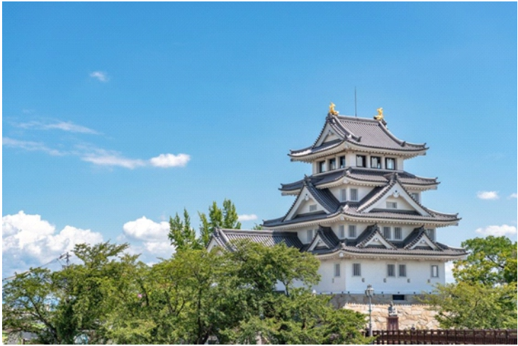
Lâu đài Sunomata ở Ōgaki

Tọa lạc tại nơi hợp lưu của hai con sông Sai và Nagara ở thành phố Ōgaki thuộc tỉnh Gifu là lâu đài Sunomata hay Ichiya (Nhật Dạ Thành). Tương truyền, nó đã được dựng lên chỉ sau một đêm.