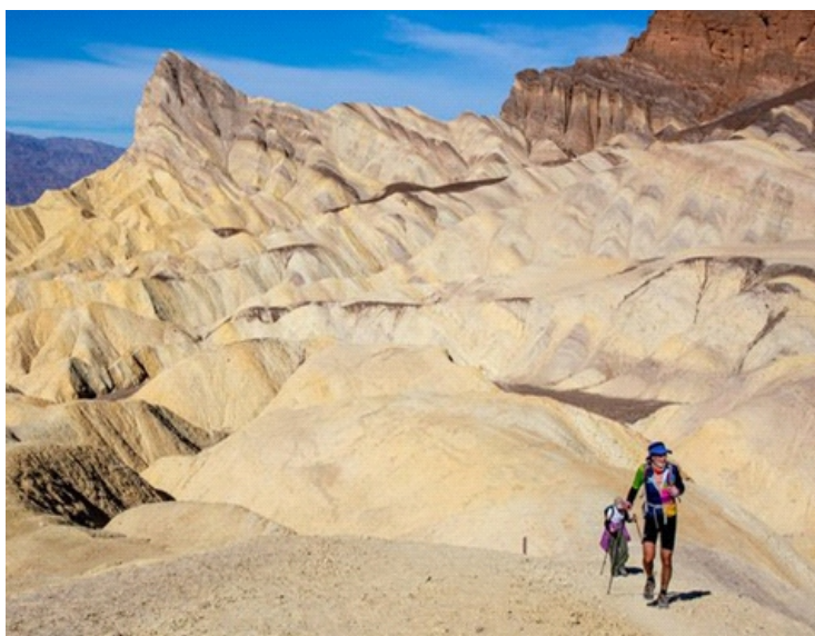
Cư dân ở Thung lũng Chết cần có sự chuẩn bị trước khi ra ngoài

Theo Brandi Stewart, một cư dân sống quanh năm ở đây và là nhân viên thông tin công cộng của Vườn Quốc gia Thung lũng Chết chia sẻ rằng, nhiệt độ vào tháng 7, 8 nóng đến mức cảm giác như bạn đang ở trong một chiếc lò nướng.